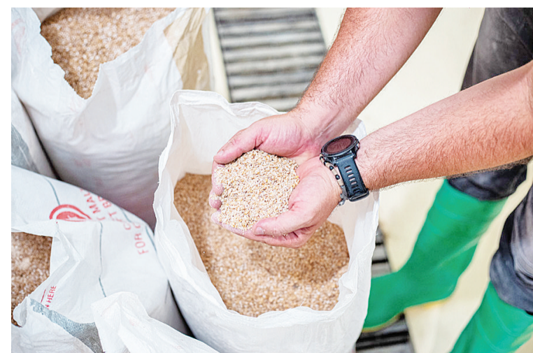
从德国进口的生麦芽