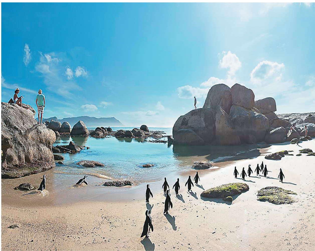
巨砾公园俗称“企鹅滩”，位于南非开普敦市南半岛区，大量企鹅在此栖息。

“哈哈”“哈哈”豪放爽朗的笑声，或是南非驻华大使谢胜文最具个性的“招牌”。对谢胜文大使的采访，在笑声中开始，在笑声中结束，全程“包袱”一个接一个，现场笑声一波接一波。 当我们笑称他是“最爱笑大使”时，谢胜文大使又是爽朗一笑：“爱笑的人身体好，南非人和中国人一样都非常热情友善。”大使的笑容，让人对万里之外的“彩虹之国”心生好感。 南非是动物与人和谐共生的乐园。各类“动物”的身影，出没在使馆各个角落。传达室墙上的巨幅草原风景图里，有一群迁徙的大象；前厅墙脚处摆放的是一人多高的长颈鹿木雕；通往二楼的楼梯转角处，两头铜雕犀牛悬挂于墙。每走到一种动物前，谢胜文大使都热情介绍：“长颈鹿在祖鲁语中意为‘头高过树冠的动物’”“犀牛有白犀牛和黑犀牛之分，但白和黑并不是指颜色，白犀牛更温顺，黑犀牛更凶猛”…… 说起南非种类繁多的动物，谢胜文大使出了道题：“‘非洲五霸’是什么？”话音刚落，大使自己抢答：“狮子、大象、水牛、豹和犀牛。”通过镜头，大使发出热情邀请，欢迎中国游客到南非草原体验敞篷越野车巡游，亲眼看看威武的“非洲五霸”。 南非是大自然眷顾的土地。这里丰饶的物产声名远播：葡萄酒、柑橘、钻石、蜂蜜……在谢胜文大使的“私家推荐榜”上，南非路易波士茶位居前列。带着货来，谢胜文大使的小幽默信手拈来：“如果女士喝了南非路易波士茶会变美，美到连地的丈夫或男朋友都认不出。”这虽是笑谈，但路易波士茶的确是深受南非人喜爱的健康饮品。路易波士茶并非真正意义上的茶，而是一种只生长在南非开普敦的灌木，有亮绿色的针状叶子，加工后呈橙红色。由于富含多种矿物质且不含咖啡因，路易波士茶老少咸宜。在南非，许多母亲从哺乳期就开始给婴儿喝路易波士茶。在南非的超市里，还能买到路易波士茶制成的香皂、牙膏、面霜等产品，到南非的游客通常会选几样作为伴手礼。 大使最后说，待疫情散去，欢迎更多中国游客走进南非。