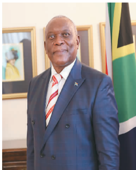
南非驻华大使谢胜文近照。