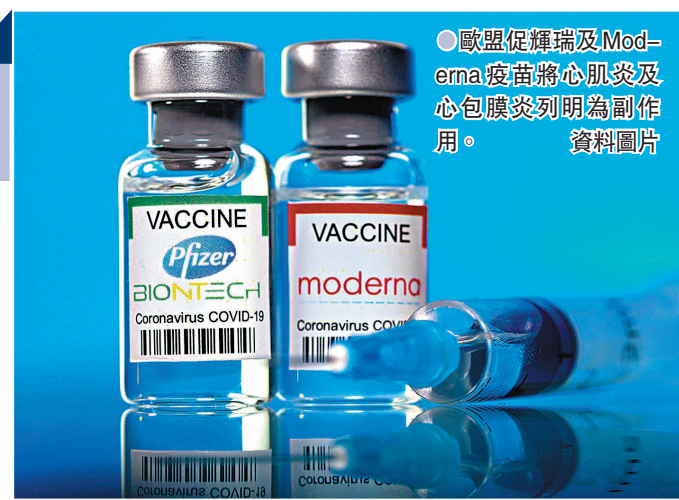
●歐盟促輝瑞及Moderna疫苗將心肌炎及心包膜炎列明為副作用。