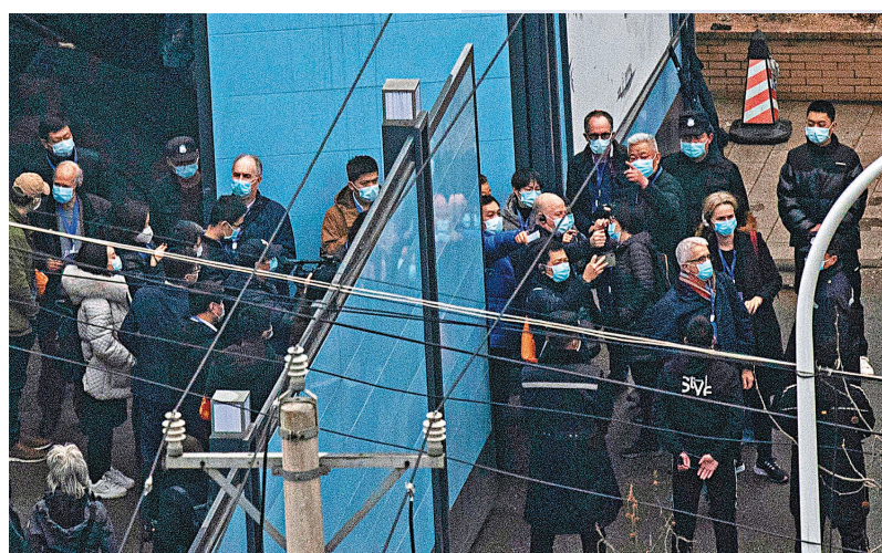
●今年1月30日世界衛生組織專家組在武漢華南海鮮市場調查。