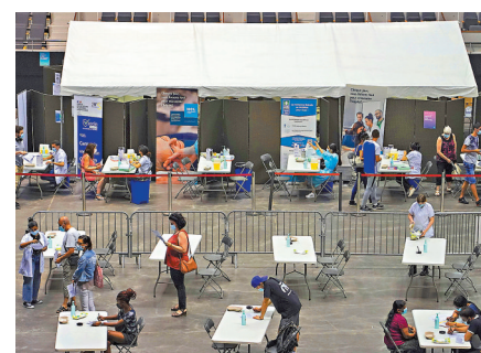
●法國里昂市民接受疫苗注射。