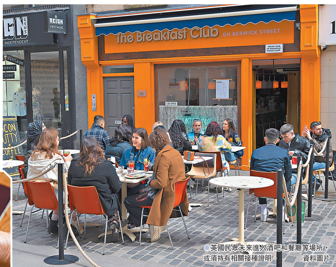
●英國民眾未進酒吧和餐廳等場所，或須持有相關接種證明。資料圖片

英國近日新冠疫苗接种人數明顯下降，年輕組別的接種意願仍然偏低，政府消息人士透露，當局正考慮在秋季推出本地使用的「疫苗通行證」，民眾必須持有相關證明，才能進入酒吧和餐廳等場所，希望藉此鼓勵年輕人打針。雖然英國疫情反彈，但首相約翰遜仍堅持本月19日解除所有防疫措施，專家認為現時仍不適宜全面解封，最新民調亦顯示，反對政府按原定計劃解封的民眾比率大幅上升。