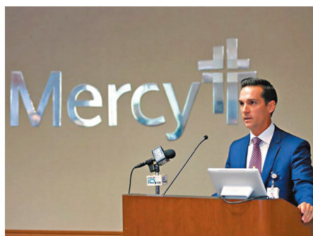
●美國仁愛醫院主席宣布所有員工須接種疫苗。網上圖片

美國再有醫療系統強制醫護人員接種新冠疫苗，密蘇里州仁愛醫院上週三宣布，要求所有員工在9月30日前完成接種疫苗，否則被終止合約。