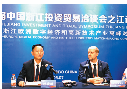
●博覽會期間，敏實集團與捷克簽訂總投資5190萬美元的合作協議。