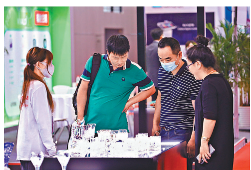
●東歐國家的水晶產品為中國消費者喜愛。