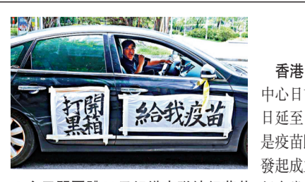
●台民間團體10日組織車隊行蔡英文辦公室表達訴求。

瑞麗疫情防控指揮部10日的媒體見面會傳出消息，瑞麗通過核檢檢測排查發現陽性病例後，快速果斷採取了一系列防控措施，嚴防疫情擴散蔓延。目前瑞麗將居民基礎信息錄入「德宏抗疫情」系統，形成了以社區網絡為最