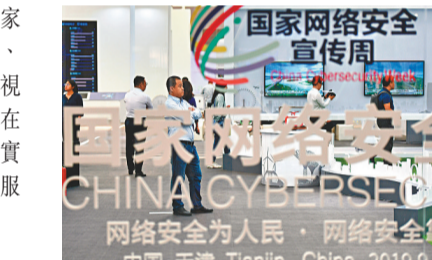
●新修訂的徵求意見稿，多項修改涉及數據安全，尤其是企業境外上市的數據安全。

內地對數據安全的監管近期驟然升溫，7月以來內地針對「防範國家數據安全風險」採取行動，接連對滴滴出行、運滿滿、貨車幫、BOSS直聘四家互聯網平台啟動網絡安全審查，滴滴更因嚴重違法違規收集使用個人信息問題，被下架App，而這些企業均於6月在美上市。與此同時，多家計劃赴美上市的內地公司調整計劃，計劃掛牌的騰訊投資暫停IPO，在線音頻平台喜馬拉雅、出行平台哈囉出行等宣布暫停境外上市計劃。中辦、國辦近日發布《關於依法從嚴打擊證券違法活動的意見》，提出加強中概股、跨境數據流動監管等。