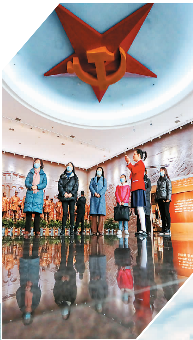
◀ 参观者在遵义会议纪念馆内听讲解。