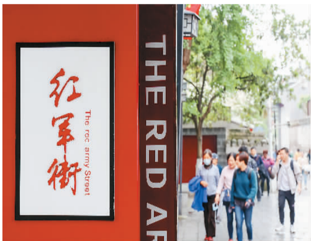
◀ 游客在遵义红军街参观游览。