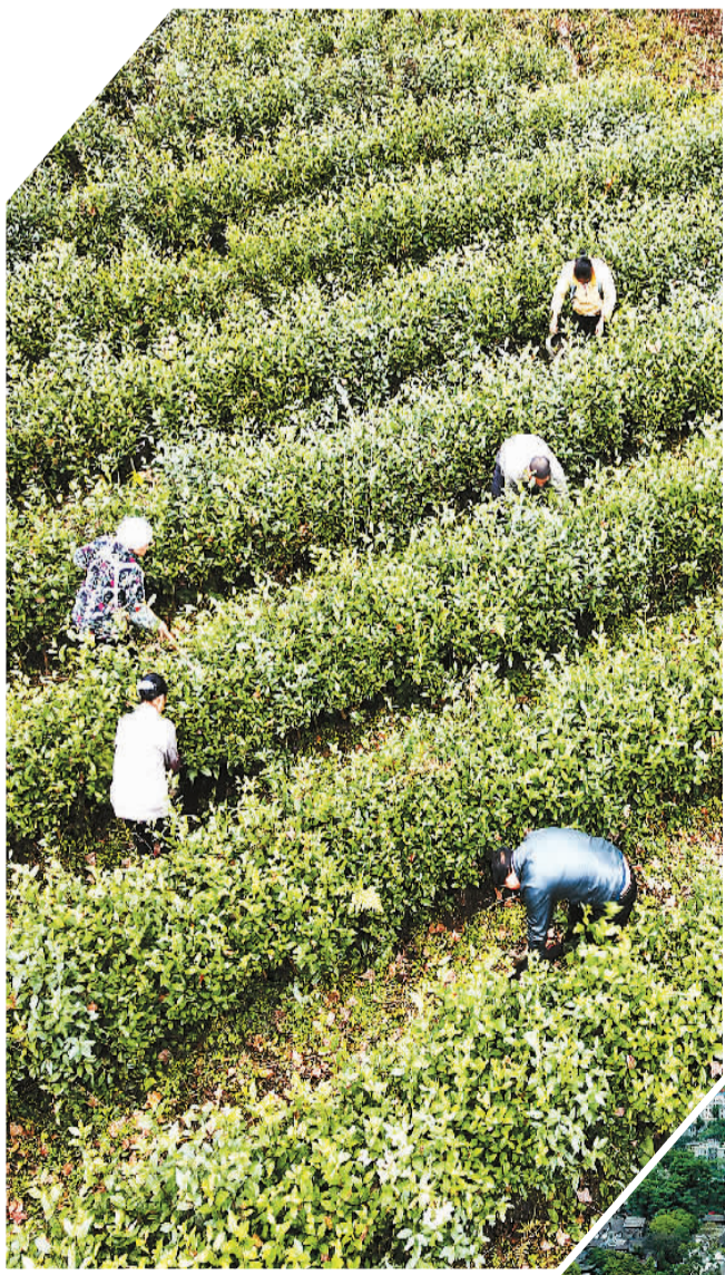
◀ 遵义市姜山春茶叶专业合作社的社员在茶园里劳作。