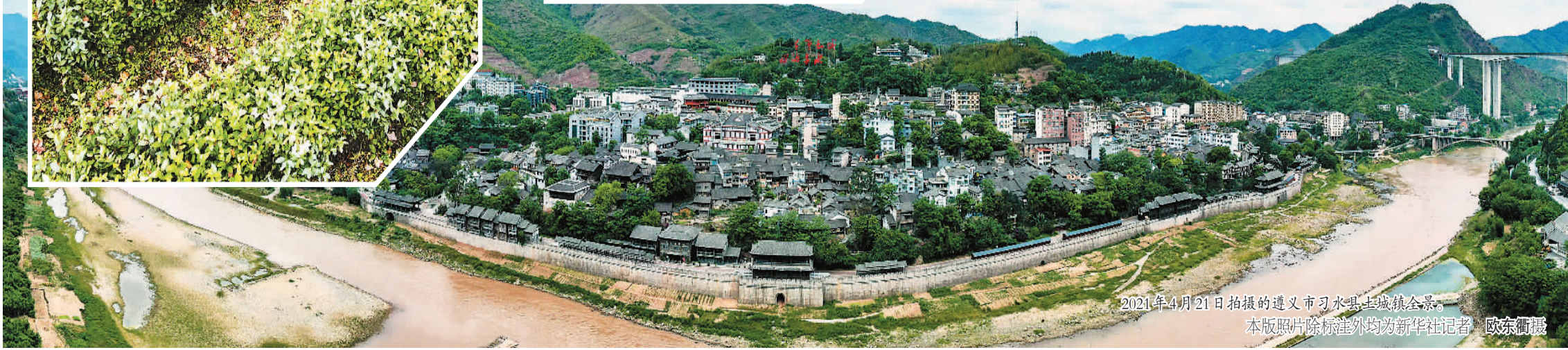
2021年4月21日拍摄的遵义市习水县土城镇全景。