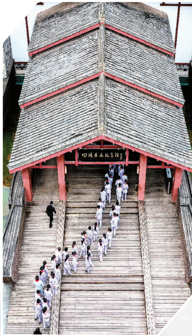
◀ 参观者进入位于遵义市习水县土城镇的四渡赤水纪念馆。