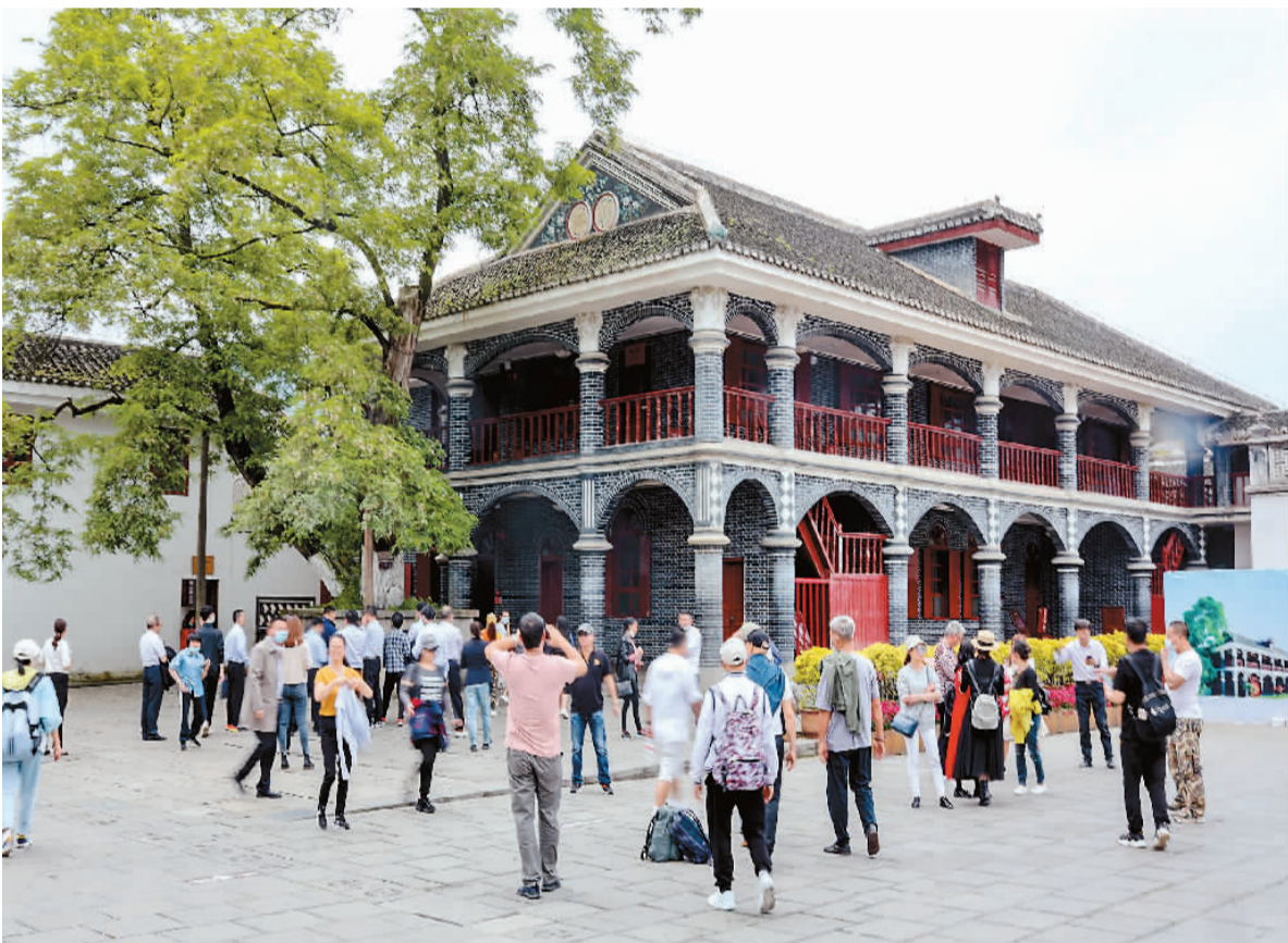
◀ 游客在遵义会议会址参观。