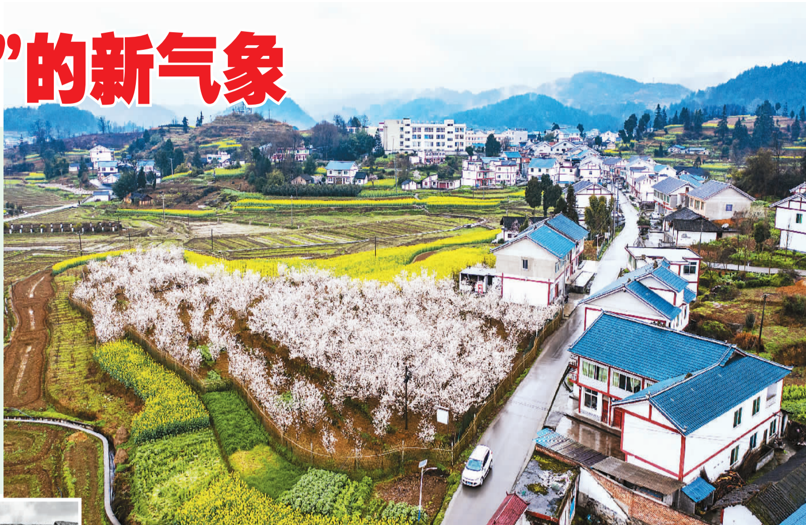
▲ 遵义市播州区枫香镇花茂村风貌。

如今，在遵义会议会址，游人如织；脱贫的村庄里，乡村产业发展如火如荼。这里是昔日中国革命的转折之地，也是中国乡村振兴的实践之处。这一组镜头，展现了遵义这一“转折之城”翻天覆地的历史巨变和发展新貌。