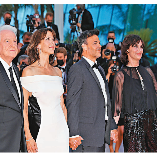
蘇菲瑪素(左二)偕同主創現身首映式。