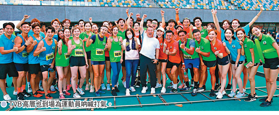
TVB高層到場為運動員吶喊打氣。