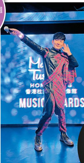
●林俊傑叮囑粉絲看到蠟像時不要碰其劉海。

香港文匯報訊(記者 李思穎)亞洲天王林俊傑(JJ)正如如火如荼準備本週六(10日)巡迴終點站「聖所 FINALE」線上演唱會,早前他更獲杜莎夫人蠟像館再次誠邀量身打造全新蠟像,並定為全球首尊華人巡迴蠟像,並將香港杜莎夫人蠟像館設為首站,為亞太巡展揭開序幕。日前JJ開直播與粉絲互動時,於無預警情況下與自己的蠟像展開一場別開生面的隔空「雲合體」揭幕儀式。直播臨近尾聲時JJ被告知某神秘人申請加入直播,畫面隨即切换到香港杜莎,只見工作人員逐步揭開JJ巡迴蠟像,首度與全新「分身」喜相逢的JJ忍不住驚呼「太逼真了!」他搞笑自誇蠟像為「我心目中的男神」,他搞笑自誇蠟像為「我心目中的男神」之餘,更不忘叮囑粉絲們看到蠟像時不要碰他的劉海。搞笑的JJ更連忙請工作人員把畫面帶到附近的「朋友圈」,周杰倫(Jay)、王嘉爾(Jackson)的蠟像隨即加入畫面,JJ自彈自唱一小段《小酒窩》,「3J組合」一起測試互動手環,粉絲直呼投入感好強。