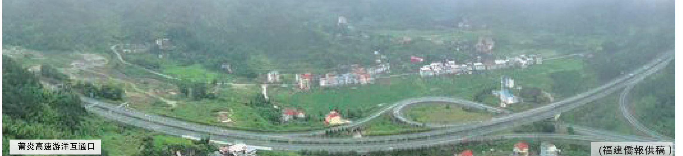
莆炎高速游洋互通口