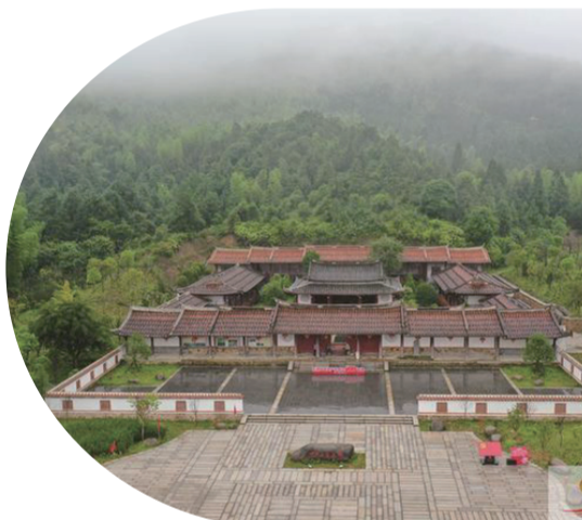
中共仙游上官支部