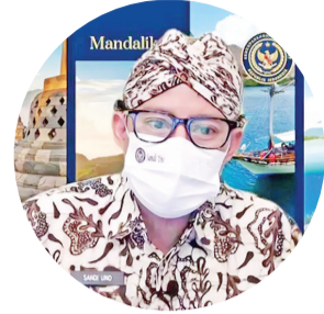
善迪亚卡部长致词