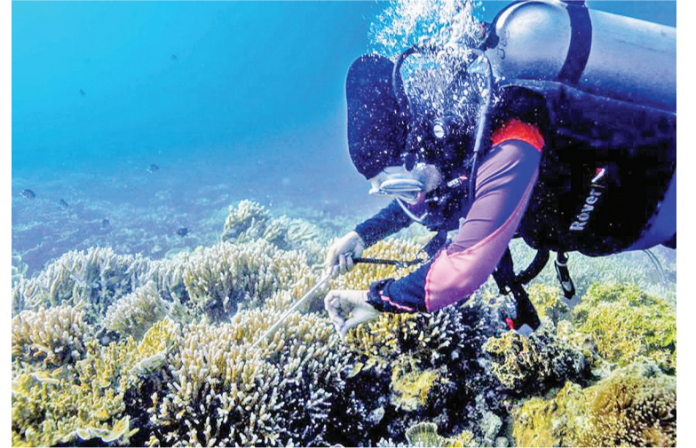
待修复的珊瑚礁园