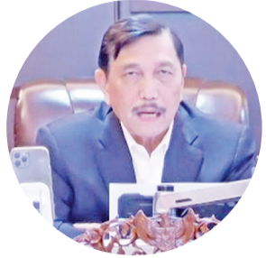
海事和投资统筹部长 卢虎致词

【本报讯】2021年7月6日(星期二),旅游和创意经济部部长善迪亚卡(Sandiaga Salahudin Uno)为国民经济复苏,全力支持劳动密集型,恢复珊瑚礁园计划,或称为2021印度尼西亚珊瑚礁花园(Indonesia Coral Reef Garden "ICRG"),作为政府为恢复因新冠疫情大流行,而严重受冲击的社区经济复苏所做的努力之一。