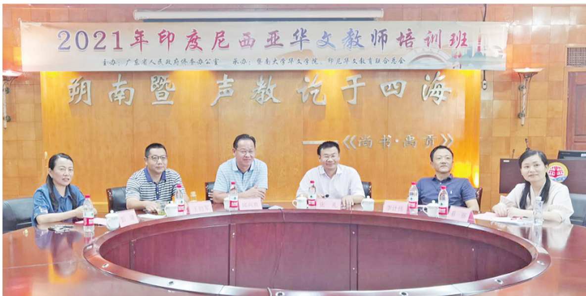
结业典礼广州现场