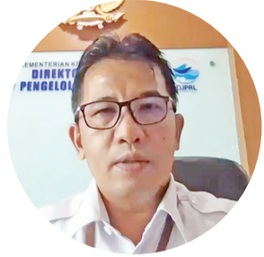
执行海洋空间管理衡德拉局长致词