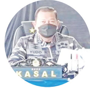
海军参谋长尤多海军上将致词

善迪亚卡在视频协调会上说,“我们非常支持,因为我们注意到游客对潜水旅游活动的兴趣显著增加,我们已经编制了安全和环境可持续性指南。”