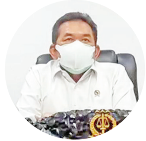
总检察长布尔哈努致词