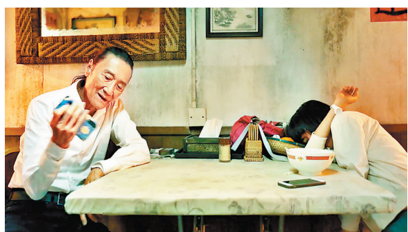
《殺出個黃昏》預告片曝光，謝賢戲路縱橫。

香港文匯報訊（記者 文芬）《殺出個黃昏》即將於7月15日在港上映，電影由林家棟監製及聯合編劇、新晉導演高子彬執導，更競逐意大利烏甸尼遠東電影節新導演單元。電影前日再收到好消息，電影即將殺入加拿大「第25屆加拿大Fantasia國際電影節」，並將於蒙特利爾舉行加拿大首