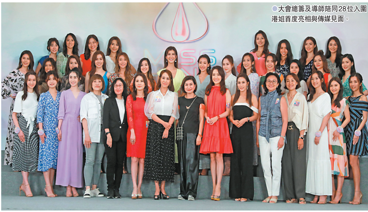
大會總籌及導師陪同28位入圍港姐首度亮相與傳媒見面。