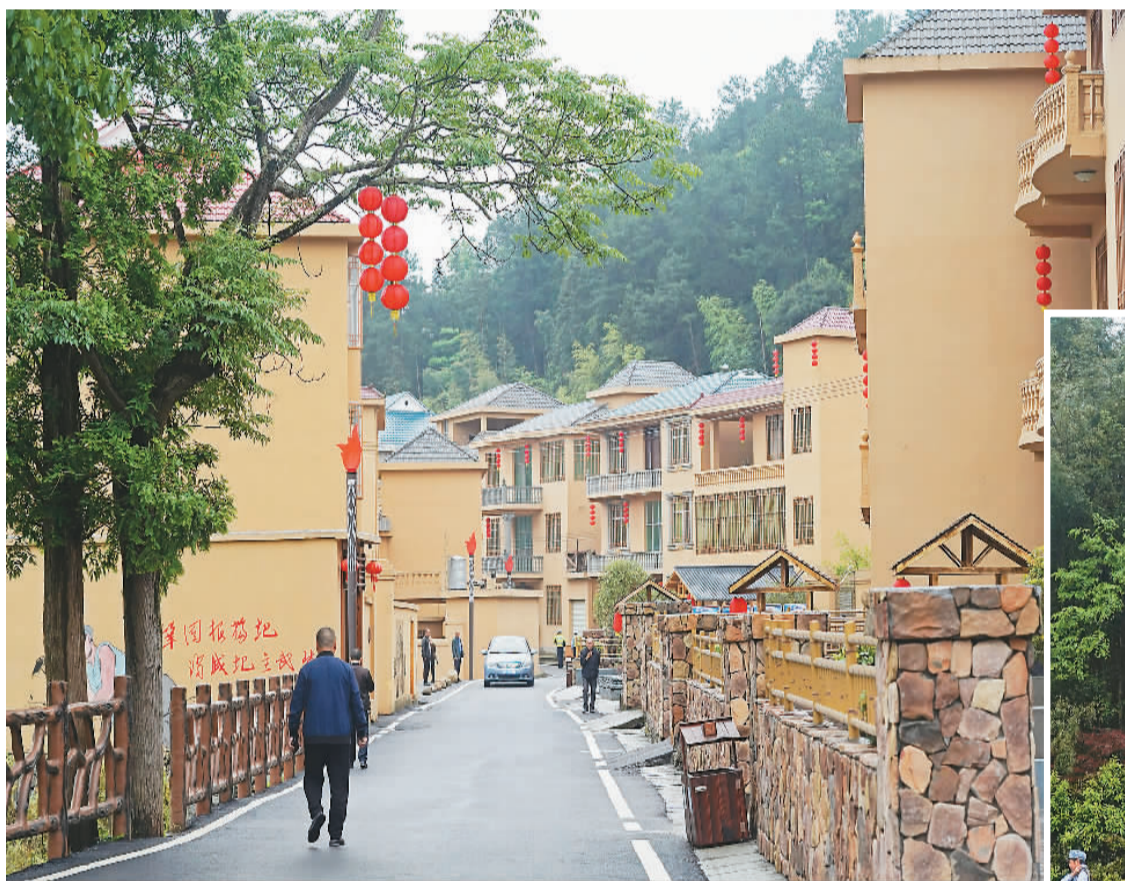
游客在位于井冈山市古田村的研学基地游览。

2017年2月，井冈山市正式宣布在全国率先脱贫摘帽，成为我国贫困退出机制建立后首个脱贫摘帽的贫困县。“红色最红、绿色最绿、脱贫最好。”今日井冈山，随处可见这样的标语。这是老百姓对美好生活的憧憬，也是井冈山因地制宜探索出的高质量发展之路。