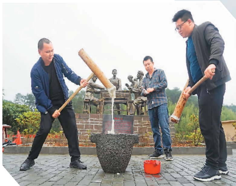
在井冈山市古田村，村民在打糍粑招待游客。