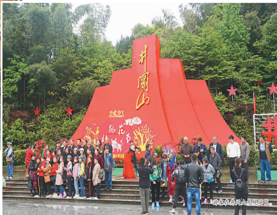
游客在井冈山参观游览。