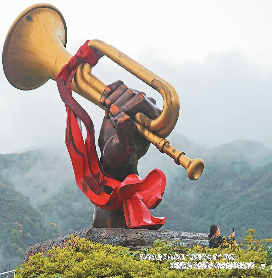
游客在井冈山参观“胜利的号角”雕塑。