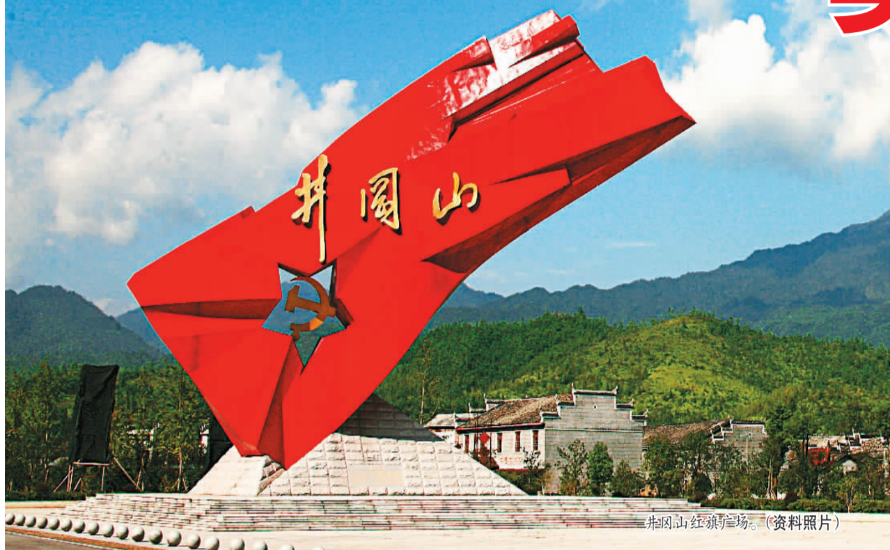
井冈山红领广场。(资料照片)