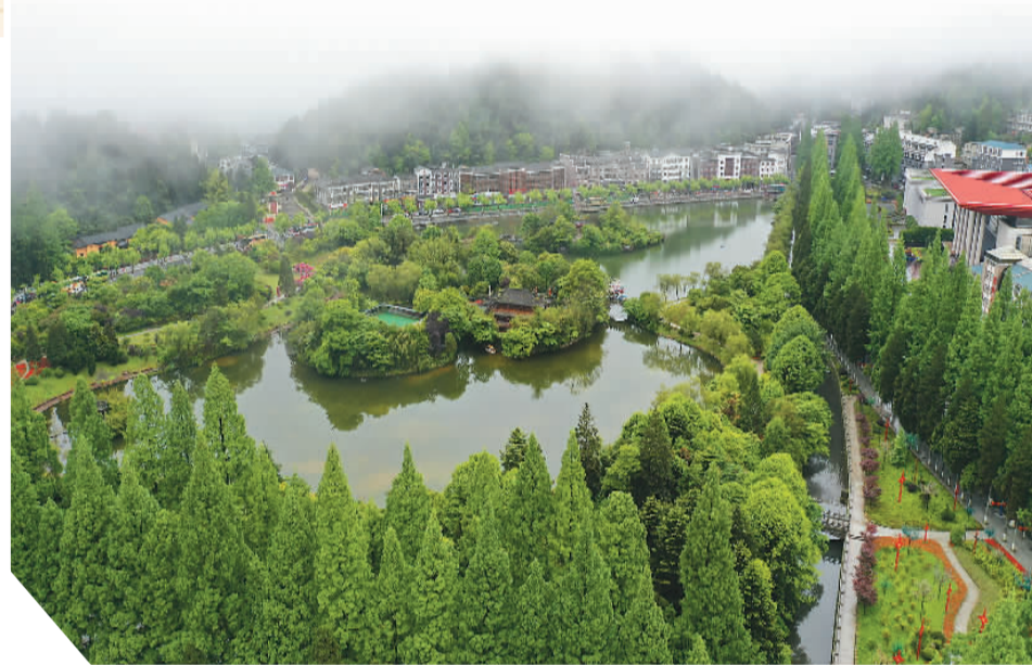
上世纪50年代拍摄的井冈山茨坪(资料照片)与2021年4月27日拍摄的茨坪今昔对比。

巍巍井冈，群峦叠翠。这里是中国革命的摇篮、著名的革命老区，但也曾是山高路陡、交通不便的贫瘠山区。1927年，中国共产党人在井冈山创建了第一个农村革命根据地，成为中国革命走向胜利的光辉起点。