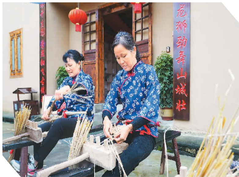
在井冈山市古田村，村民在编草鞋纪念品。