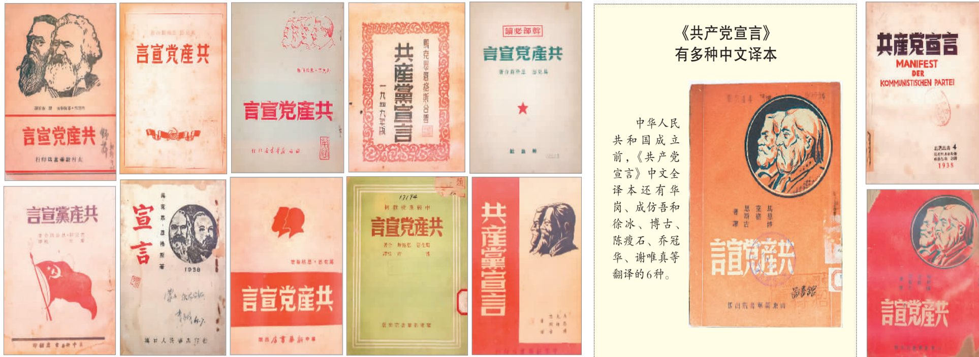
《共产党宣言》有多种中文译本

中共一大会议地址上海法租界望志路106号(今兴业路76号)。1921年7月23日,中国共产党第一次全国代表大会在此召开。来自7个共产党早期组织的13位代表出席了会议,他们代表了全国50多名党员。大会通过了中国共产党的第一个纲领和第一个决议,选举产生了中央领导机构,宣告了中国共产党的诞生。