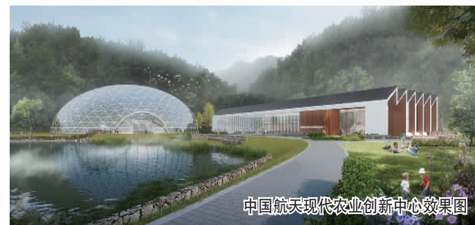
中国航天现代农业创新中心效果图

今年以来，黄埔区、广州开发区利用产业集群和科技创新优势，从科技农业、科技产业、特色精品村建设、农文旅及农业园等方面重点谋划打