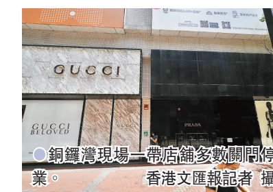
銅鑼灣現場一帶店舖多數關門停業。

香港市民終於可以繼續過正常的生活，「我們是否想繼續讓這些不希望香港安寧的人及背後推手出來，令我們繼續互相仇恨，繼續鼓吹暴力，繼續美化這些恐怖主義呢？」