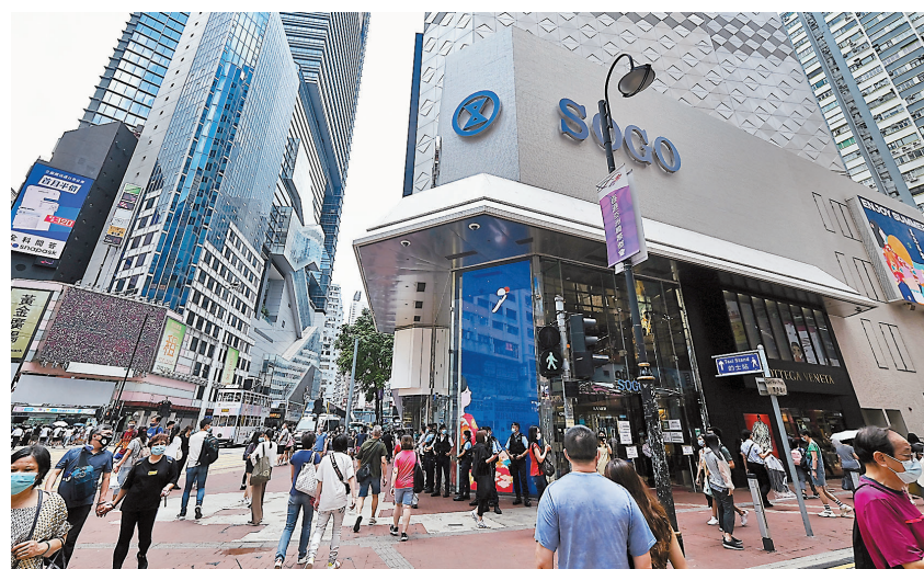
香港警方3日繼續在銅鑼灣傷警現場駐重兵戒備。

李家超3日以「政府全力打擊本土恐怖主義」為題發表網誌。他直言，2019年6月後發生的黑暴，破壞了香港整體安全，包括市民被無辜襲擊、公物被嚴重破壞、大量汽油彈被投擲、交通被嚴重癱瘓等，但更影響深遠的是，守法意識被嚴重破壞，本土恐怖主義更開始滋生。