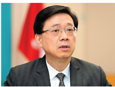
香港政務司司長李家超3日發表上任後首篇網誌，強調香港特區政府會全面防範及打擊本土恐怖主義。資料圖片