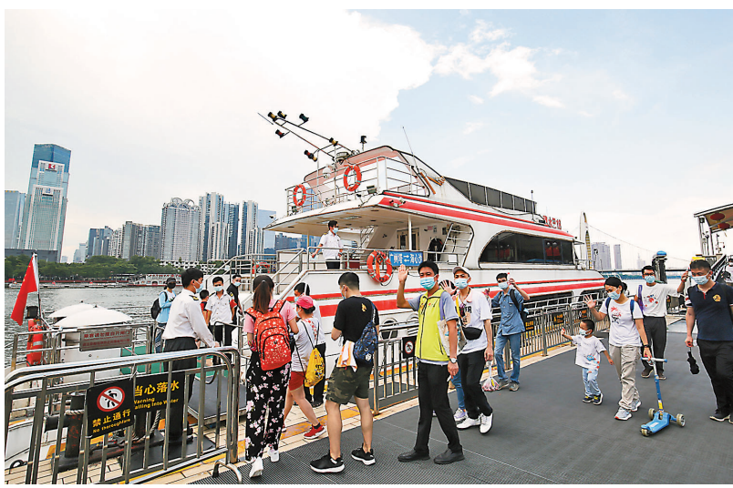
取消48小時核酸檢測陰性證明後，廣州荔灣區一家十五口組團赴京遊。