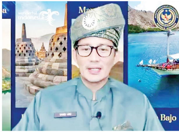
善迪亚卡在主持启动会上致词

启动廖内马来创意经济和文化中心的建设和利用。希望它可以鼓励创新,鼓励合作,对所有利益相关者,根据3G原则,迅