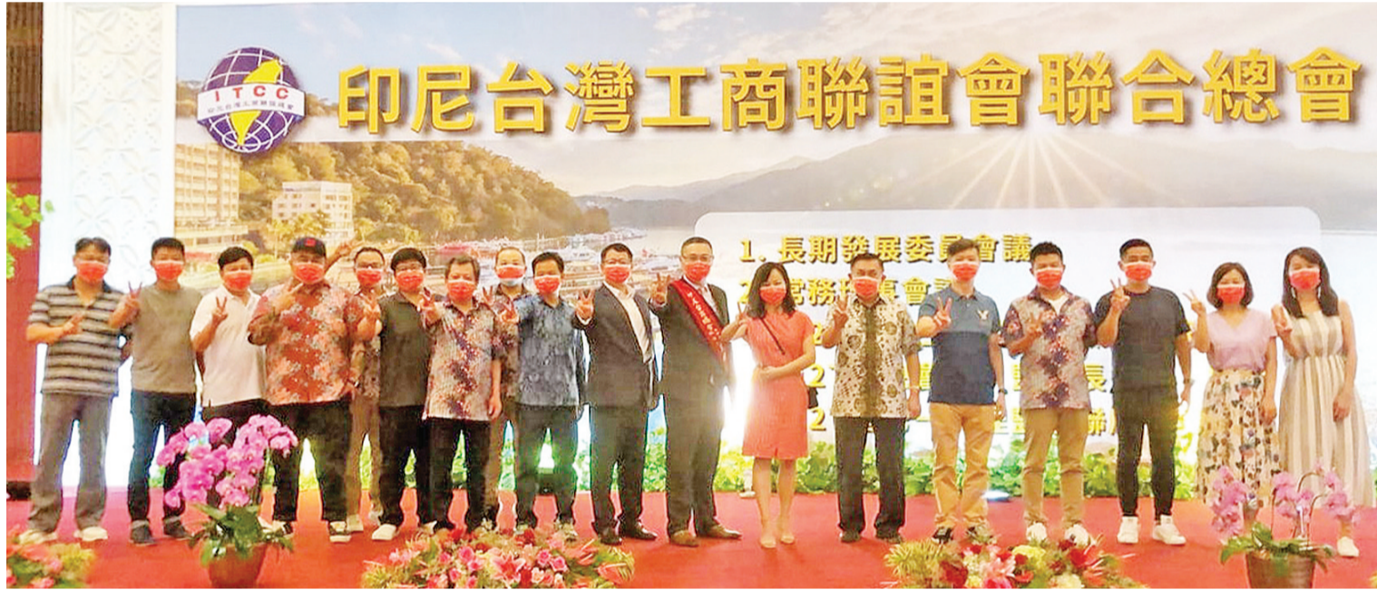
全体与会者与理监事合影

【万隆讯】6月26日，印尼台湾工商联谊会联合总会暨客属联谊会大礼堂举办第26届、27届总会暨监事长交接典礼。由于万隆疫情还很严峻，政府呼吁要保持卫生规则而不可多人聚会。参加现场交接典礼人数只有十多位并全都