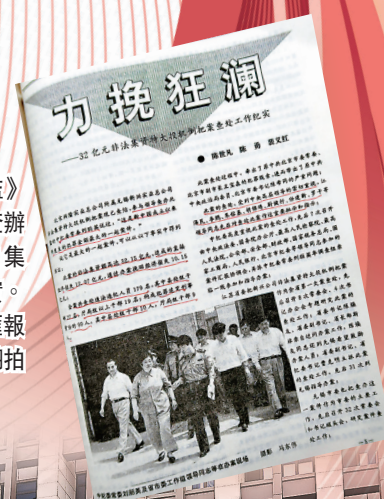
●《江蘇紀監》刊發曹克明查辦逾32億非法集資案工作紀實。