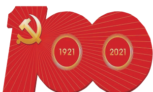
慶祝中國共產黨成立100周年

香港文匯報訊(記者 蘇榕蓉、張帆 福州、上海報道)7月1日上午,慶祝中國共產黨成立100周年大會在北京天安門廣場隆重舉行。有一群來自海峽對岸的特殊嘉賓——台胞也受邀在現場觀禮。在現場聆聽了習近平總書記慶祝大會的重要講話後,台胞們感慨萬分,第一時間紛紛在自己的朋友圈晒出天安門現場盛景。有台灣青年向香港文匯報記者表示,在祖國大陸,時時刻刻能感受到執政黨對民眾的在乎和「為人民服務」,是「說到做到」,而不是口號。