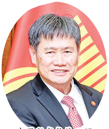
东盟秘书长林玉辉