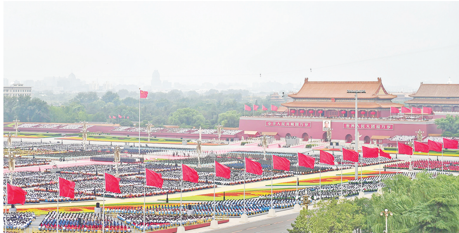
天安门广场庆祝大会现场。