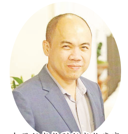
东盟秘书长副秘书长康富

中国的发展为世界其他国家提供了重要借鉴与启示,令人鼓舞。康富并赞赏中国在国际抗疫和经济复苏合作,特别是疫苗合作方面给予东盟和世界其他国家的巨大帮助,积极评价东盟与中国在社会人文领域合作丰硕成果,期待双方以中国