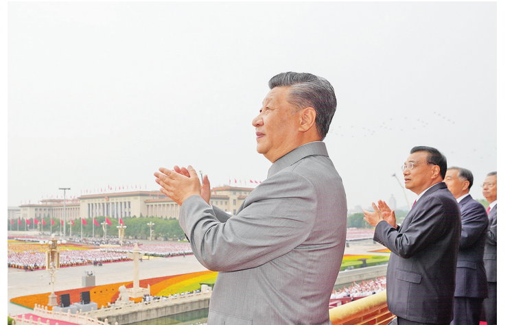
习近平在天安门城楼上。