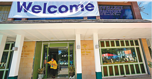
珠寶店職員準備營業。

因疫情封關一年多的泰國旅遊勝地布吉島，1日正式恢復對海外遊客開放，已完成接種新冠疫苗的旅客可豁免隔離檢疫，當局希望能重振當地旅遊業。然而島上商戶對此不太樂觀，指出很多店舖在疫情期間已經倒閉，當局卻未有提供足夠援助，即使布吉島重新開放，他們也沒有能力接待遊客。