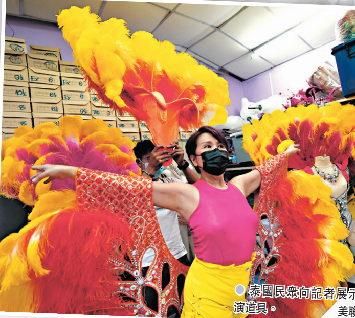
泰國民眾向記者展示表演道具。