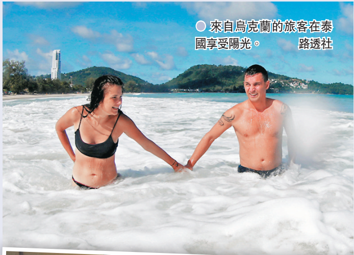
來自烏克蘭的旅客在泰國享受陽光。

受變種病毒影響，泰國近日疫情持續升溫，6月30日再有多53人死亡，創單日新高，曼谷及周邊地區防疫措施多次收緊。當局曾考慮推遲布吉島重開計劃，但島上已有2/3居民接種疫苗，加上旅客需遵守嚴格防疫規定，因此決定維持在1日重開。 ●路透社/法新社