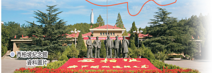
西柏坡紀念館 資料圖片

會議等。故有「新中國從這裏走來」、「中國命運定於此村」的美譽。2013年7月11日，中共中央總書記習近平第二次調研西柏坡時鄭重指出，黨面臨的「趕考」遠未結束，要求各級領導幹部帶頭堅持「兩個務必」，即務必使同志們繼續地保持謙虛、謹慎、不驕、不躁的作風，務必使同志們繼續地保持艱苦奮鬥的作風。