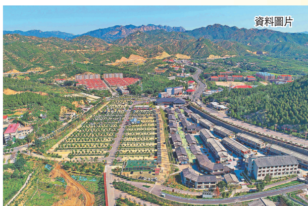
今日 西柏坡文旅小鎮