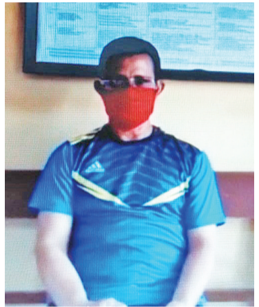
服用伊维菌素康复 见证者致词

作为预防或预防药物,伊维菌素对新冠 Covid-19 疫情的有效率为85%,早期治疗为76%,并将死亡率降低70%。在最近的一项研究中,结果表明伊维菌素可以阻止新的新冠疫情变体的发展,例如来自英国、越南和印度的变异新冠病毒。