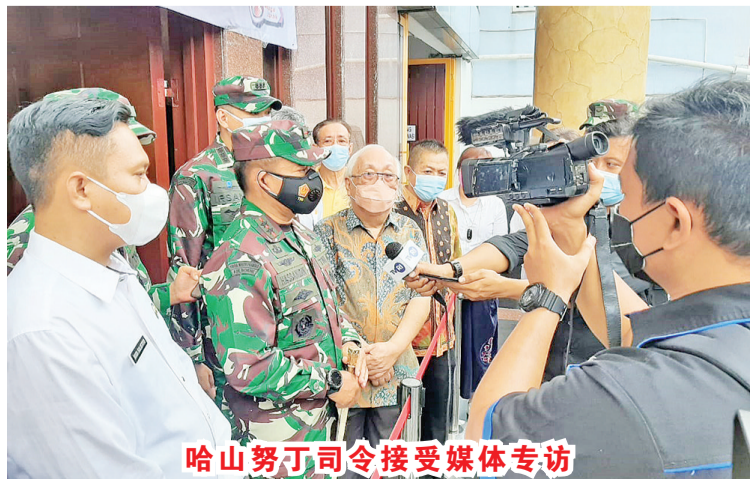
哈山努丁司令接受媒体专访

会二十万份中国科兴疫苗在全国各地同时进行。苏北省佛教总会因此与第一军区合作,在棉兰江夏会所及先达陆军医院进行接种活动。第一军区司令哈山努丁少将今天亲临现场视察,看望接受疫苗者,并与他们亲切交谈,希望疫苗能有效遏制病毒传播,同时提醒市民接种后仍然必须注意防范,戴口罩勤洗手保持距离。