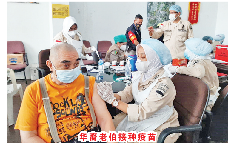
华裔老伯接种疫苗