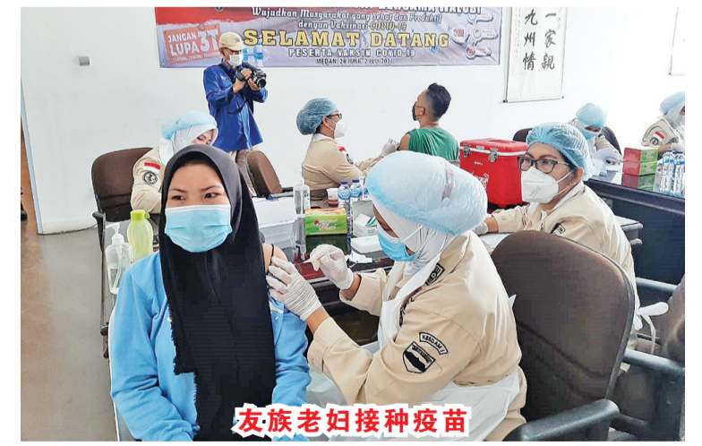
友族老妇接种疫苗