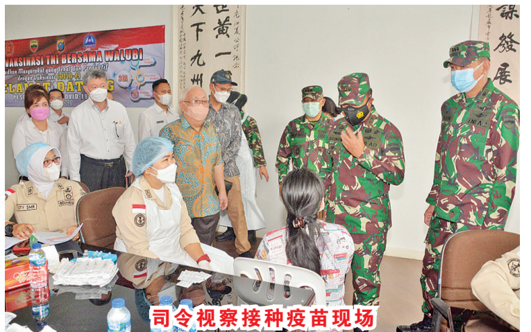
司令视察接种疫苗现场

【棉兰讯】6月28日,苗接种计划,提高人民抗为响应总统号召,加强疫体,三军司令部与印尼佛