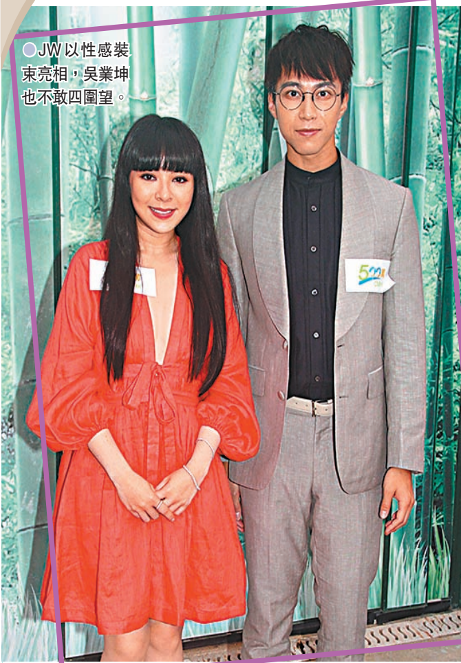
●JW以性感裝束亮相，吳業坤也不敢四圍望。