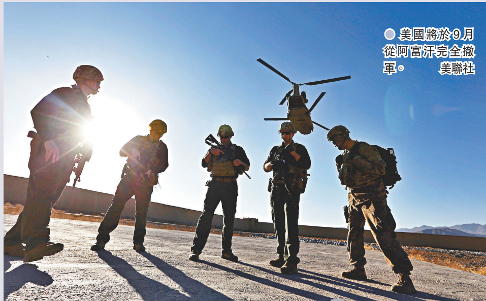
● 美國將於9月從阿富汗完全撤軍。

美國計劃於今年9月11日前從阿富汗完全撤軍，不過阿富汗安全局勢近日急轉直下，塔利班發起大規模攻勢，更奪取多個省會及據點。就在阿富汗總統加尼25日訪美前夕，華府官員向媒體放風，指美國情報機構認為，由於塔利班加強攻勢，加上政府軍士氣低落，屢屢不戰而降，阿富汗政府最快或於美軍完全撤出的6個月後倒台。