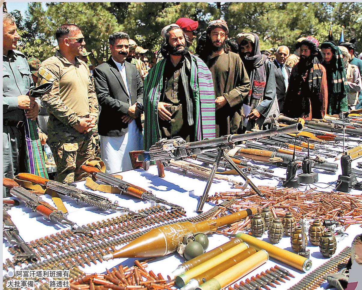
● 阿富汗塔利班擁有大批軍備。