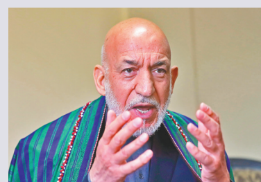
● 卡爾扎伊是阿富汗第一位民選總統。

阿富汗前總統卡爾扎伊日前接受美媒專訪時痛斥說，自20年前美國發動阿富汗戰爭以來，美國未能完成給飽受戰爭折磨的國家帶來穩定和打擊極端主義的目標。諷刺的是，現時極端主義還在阿富汗達到了頂峰。卡爾扎伊直言，沒有美國的軍事存在，阿富汗會過得更好，「美國在阿富汗的戰爭失敗了……留下的只有徹底的恥辱和災難。」