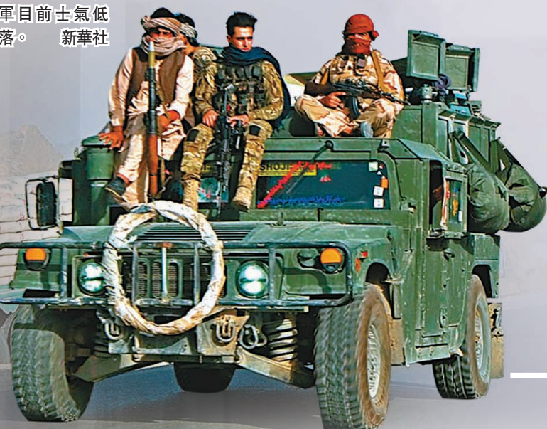
● 阿富汗政府軍目前士氣低落。新華社