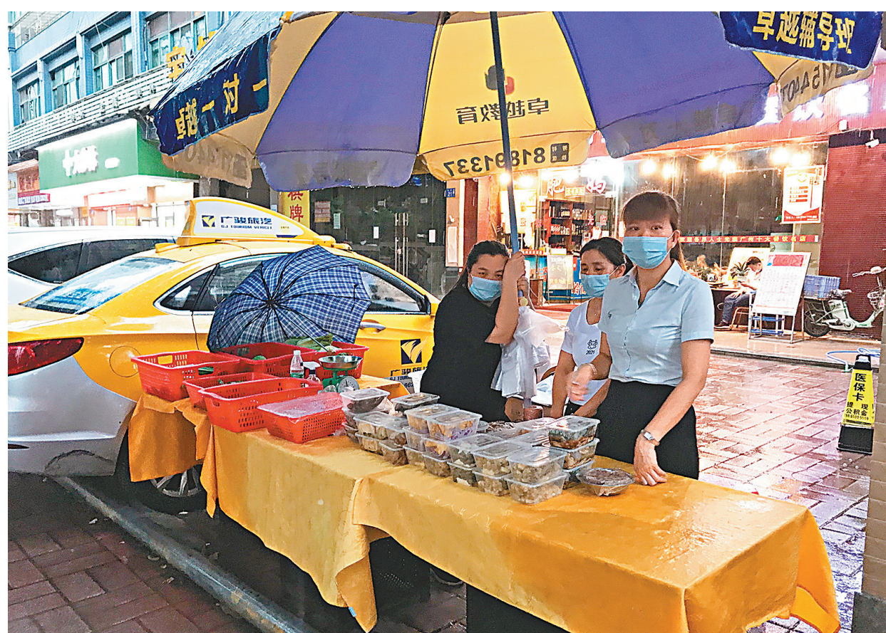
●有餐飲店在路邊擺攤賣菜, 但客人極少。

事實上, 餐飲行業在次輪疫情中的影響幾乎是最大的。廣東省餐飲服務行業協會調查顯示, 廣州近9成的受訪企業營收同比下降50%以上, 近5成企業營收同比下降80%以上, 超過9成企業反映員工薪酬發放成為當前餐飲業最大的困難, 難以承受門店租金壓力的企業佔比達到85%以上。