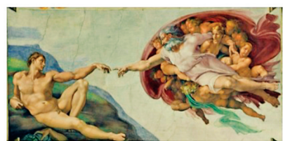
●米開朗琪羅創作的《創造亞當》，令人目眩神迷！(資料圖片) 作者供圖

米開朗琪羅在為西斯廷教堂繪製天頂畫的實際工作中，可謂舉步維艱，他在一封致父親的信中稱：「我的精神處在極度的苦惱中。一年以來，我從教皇那裏沒有拿到一文錢；我什麼也不向他要求，因為我的工作進度似乎還不配要求酬報。工作遲緩之故，因為技術上發生困難，因為這不是我的內行。因此我的時間是枉費了的。神佑我！」 一開始，他便碰了釘子，他剛畫了《洪水》部分圖案，因不得法，作品不久已發霉了，他不得不重頭開始。 屢敗屢戰正是他不屈不撓的堅毅性格。起初教皇因他工作進度的遲緩而發怒，更有甚之，米開朗琪羅執意不讓教皇看已完成的部分作品。 每次米開朗琪羅都對教皇重複說：「當我能夠的時候，當我能夠的時候。」教皇怒極而用他的權杖毆打他。 米開朗琪羅受辱後，決定執包袱再度離開羅馬。 後來教皇感到悔意，趕快派人把他截住，並向他道歉，施以利誘，送他 500 金幣，終於把他挽留住了。 到翌日，米開朗琪羅在教皇要求檢視壁畫時，他又像過去重演一次，