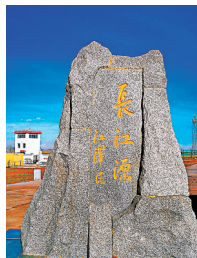
●長江源紀念碑！

來到鎮上，帥哥司機和我先找店投宿，再找家麵館吃熱湯麵。麵館東家說：「唐古拉鎮面積4萬8千平方公里（48個香港大），人口1,900人。」這裏酷寒乾旱，空氣異常稀薄，處於人類生存的臨界點。我來到這裏，帶着爸爸媽媽踏足地廣人稀的長江第一鎮，體驗高原地區的艱苦生活，難能可貴啊。 從長江第一鎮向前走2公里，我到了長江源頭第一橋，名叫「沱沱河大橋」。6,380公里的長江上有超過200座公路橋，我們現在踏足的，就是長江流域上的第一座橋。 走過第一橋，一塊高2米、上刻「長江源」的白色玉石紀念碑矗立眼前，碑石後銘刻「江河暢，民心順；湖海清，國運昌。」「青山碧