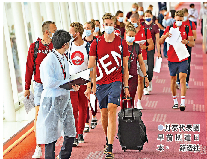
丹麥代表團早前抵達日本

開放觀眾入場的決定公布後，不少奧運籌備相關人士都表示鬆一口氣，一名都政府官員表示，由於之前都不知道有多少觀眾入場，所以都無法訂立相關規定，「如今總算走到起跑線了」。至於持票民眾則意見分歧，一名持有摔跤決賽門票的東京居民表示，十多名親戚一起參加抽籤才抽到一張門票，因此即使縮小規模也希望入場；不過另一名持有女子足球準決賽門票的大阪居民則表示，還不知道要不要專程到東京觀賽，「很多事情還不確定」。