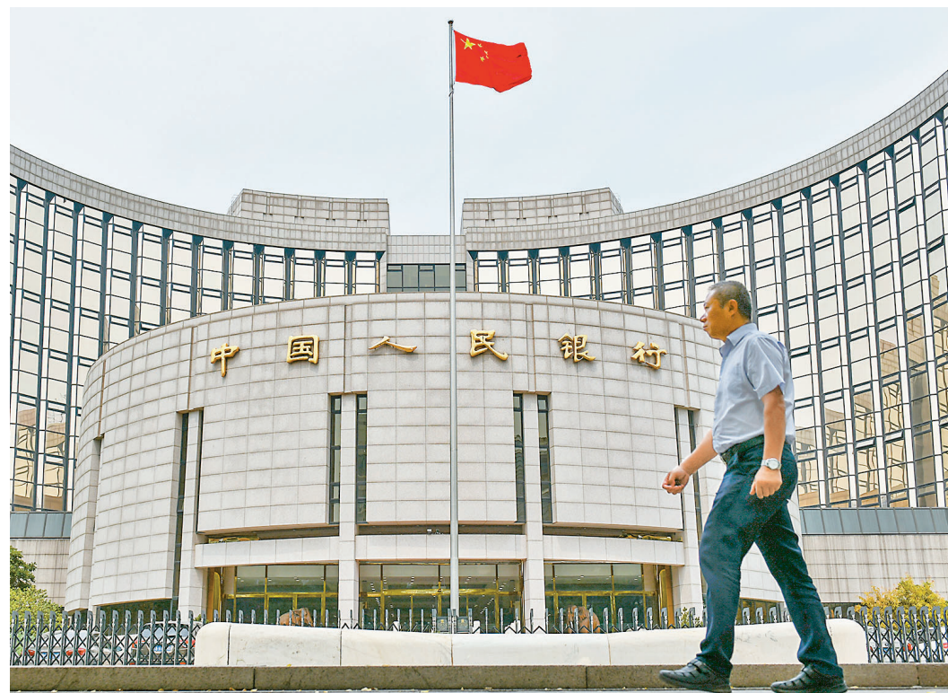
●人民銀行有關部門近日就銀行和支付機構為虛擬貨幣交易炒作提供服務問題,約談多家銀行和支付寶等支付機構。資料圖片

據CoinDesk數據,截至21日下午7時20分,比特幣(BTC)報32,094美元,一日內跌近10%;以太幣首跌穿2,000美元關口,報1,978.4美元,跌6.3%。比特幣今年的高點是4月15日觸及的63,381.20美元。