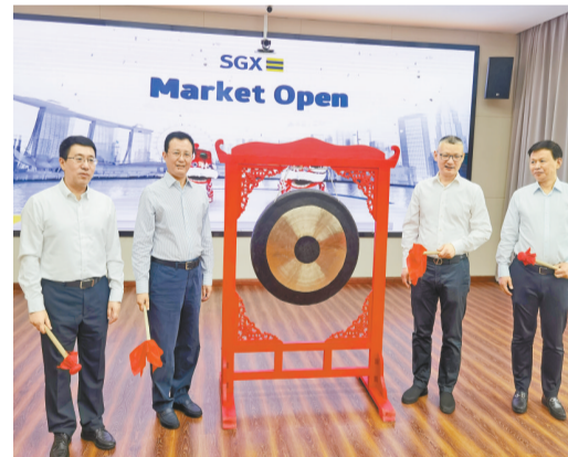
重慶南岸城建集團獅城發債「雲」敲鐘。

【香港商報訊】記者童文武、蔣曦報道：渝南岸城建集團獅城債券上市「雲」敲鐘活動昨日在重慶舉行，南岸城建3.5億美元獅城債券在新加坡交易所掛牌上市。這是新冠肺炎疫情發生以來，重慶企業首次赴新加坡發行海外債券。