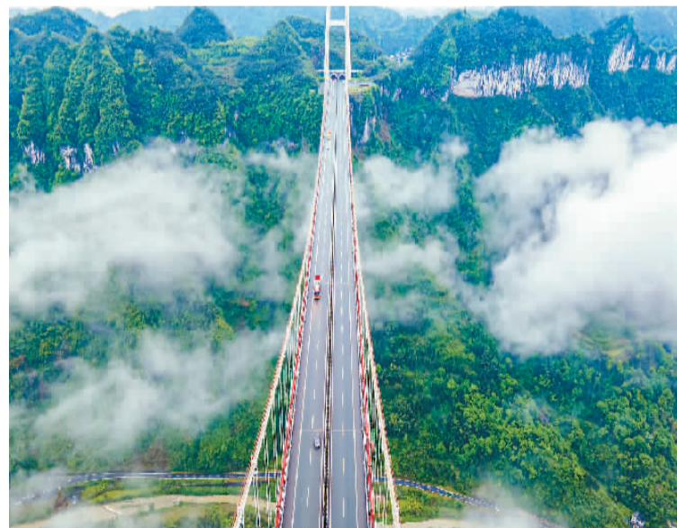
▲包茂高速湖南省湘西土家族苗族自治州吉首市矮寨特大悬索桥云雾缭绕,美如画卷。