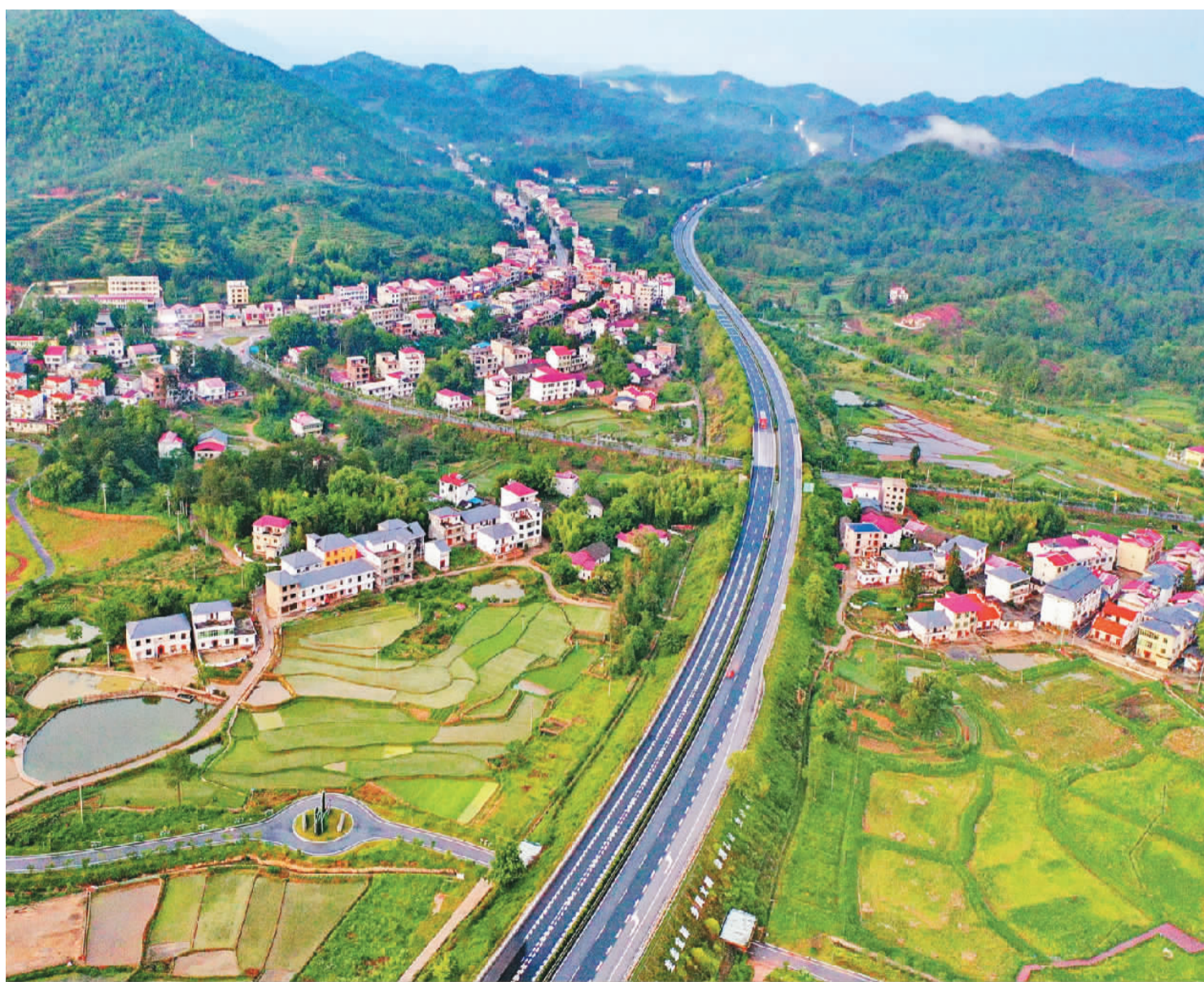
▲厦蓉高速江西省赣州市会昌县会昌北路段,两侧的客家民居、旅游景点映入眼帘,一派绿意盎然的乡村景象。“高速公路+特色产业”“高速公路+乡村旅游”等发展模式,把一条条高速公路变为乡村振兴和农民致富“加速带”。