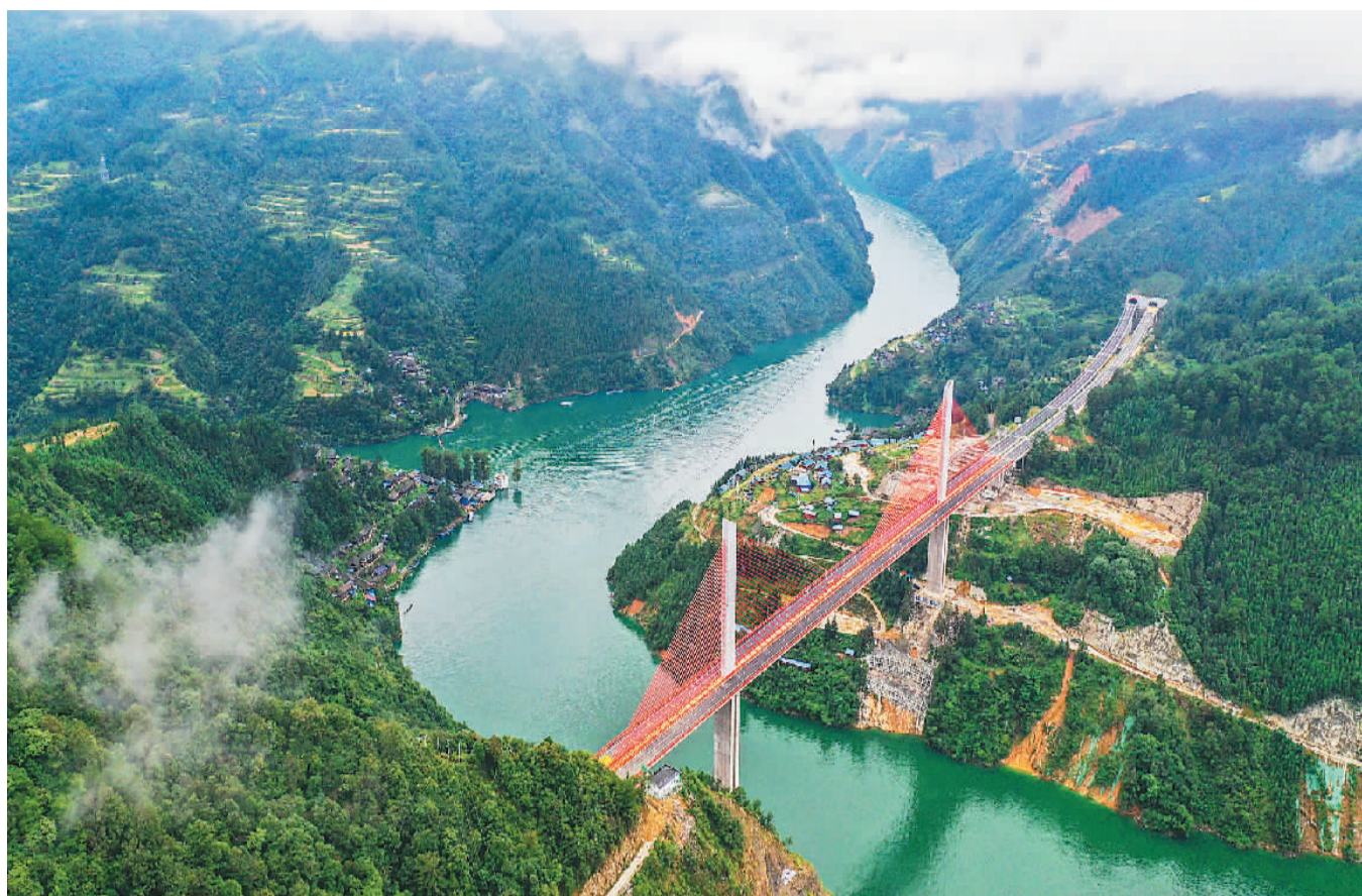
▲贵州剑河至榕江高速公路清水江特大桥。剑榕高速公路跨越三穗、剑河、榕江三县，其开通运行打通了黔东南区域对外交流快捷通道。