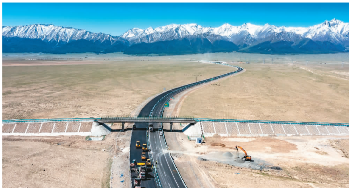
▲京新高速新疆哈密市松树塘施工现场机器轰鸣,建设者在摊铺沥青。京新高速穿过广阔的大漠戈壁,将北京到乌鲁木齐的公路距离缩短了三千三百多公里。

穿越绿水青山,联通东西南北,让优质的货物往来各地,让沿途百姓驶上幸福快车道。今天,人们可以沿着高速看中国,饱览大好河山,感受奔腾时代!