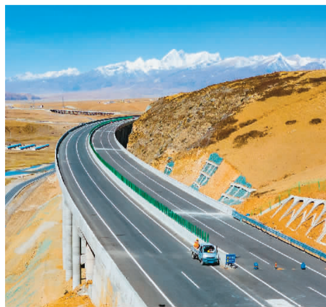
▲京藏高速西藏那曲至羊八井段通车在即,项目的通车对完善西藏路网结构和功能等具有重要意义。