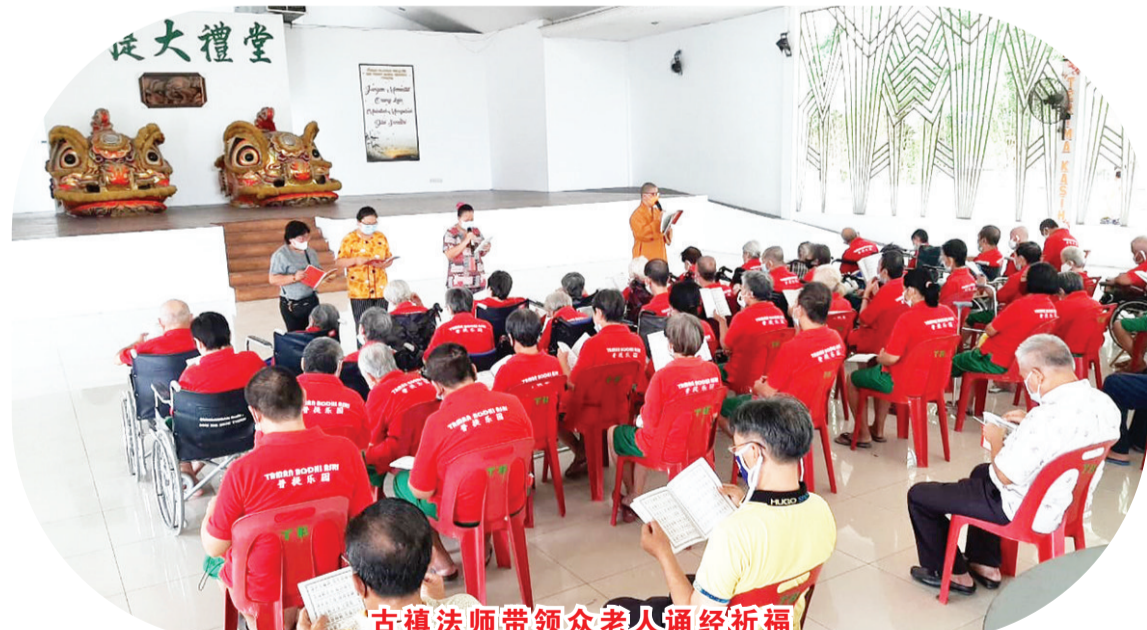
古祺法师带领众老人诵经祈福