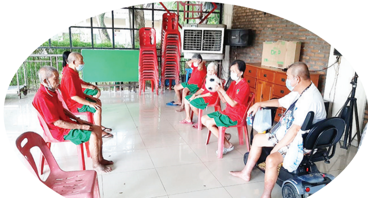
老人们午时玩球运动