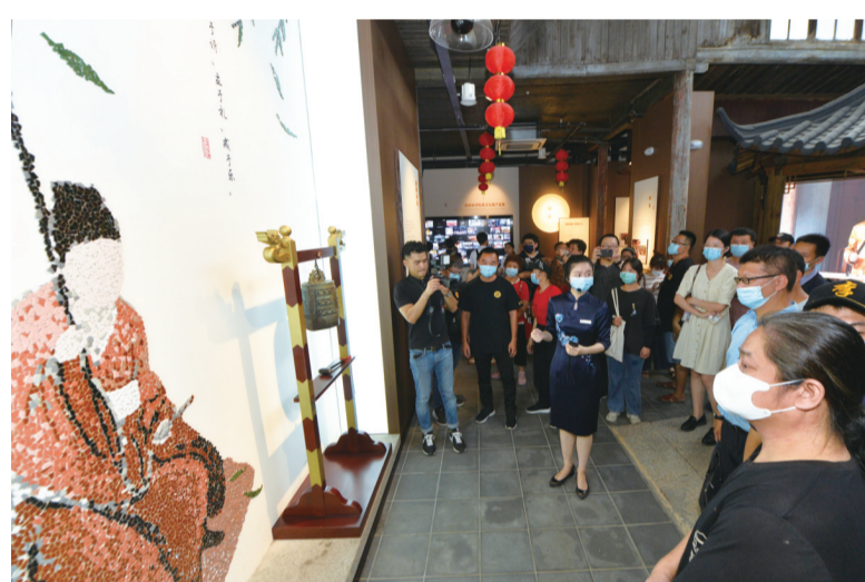
两岸青年参观福州市非遗展示馆。