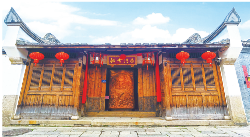
福州台湾会馆。

位于三坊七巷历史文化街区黄巷51号和麒麟弄3号院落的福州台湾会馆,周末经常成为在榕台胞的聚集地。而在100多年前,它是台湾士子科考的栖身地。古往今来,福州台湾会馆承载着两岸同宗同文、同根同源的血脉深情。