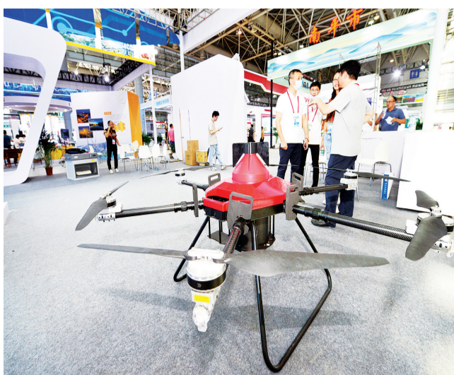
这款消防无人机一次可携带40公斤灭火弹。

据介绍,它一次充满电可持续作业6小时,作业效率高。同时,它应用高精度环境感知、定位、自适应作业等全方位智能化系统,实现无人驾驶,具备灵活设置作业路径、主动避障等功能。