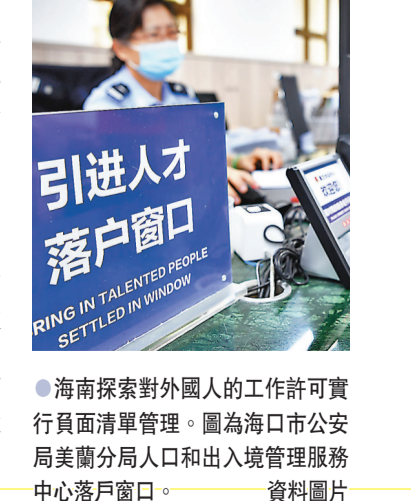
●海南探索對外國人的工作許可實行負面清單管理。圖為海口市公安局美蘭分局人口和出入境管理服務中心落戶窗口。