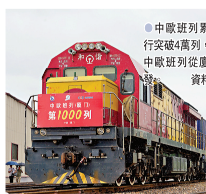
●中歐班列累計開行突破4萬列，圖為中歐班列從廈門出發。資料圖片