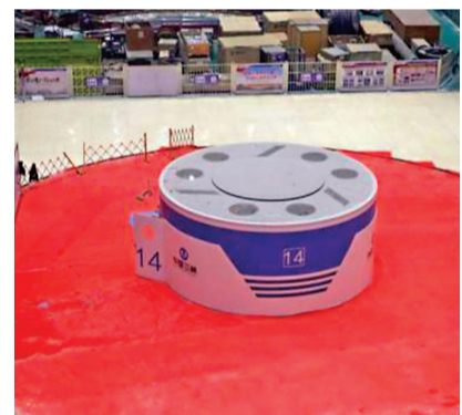
●21日8時58分36秒，白鶴灘水電站14號機組發出了全球首台百萬千瓦水輪發電機併網調試的第一度電。網絡圖片

據了解，白鶴灘水電站500千伏送出工程於2020年9月開工，主要包括4條500千伏輸電線路和2個500千伏變電站的改造擴建工程，工程總投資24億元人民幣，新建鐵塔758基，線路全長435千米，途經四川省涼山彝族自治州昭覺縣、布拖縣、寧南縣。國家電網四川省電力公司克服雨季延長、高山地區冰凍嚴寒、物資運輸困難、森林防火壓力巨大等諸多困難，投入6,000多名電力工人，歷經9個月時間，完成了建設任務。