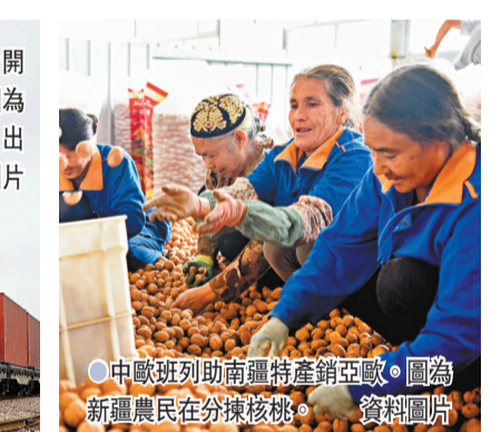
●中歐班列助南疆特產銷亞歐。圖為新疆農民在分揀核桃。