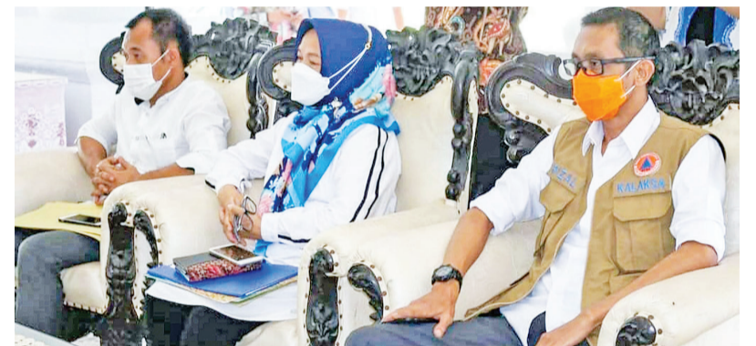
县长与嘉宾等在捐助移交仪式上