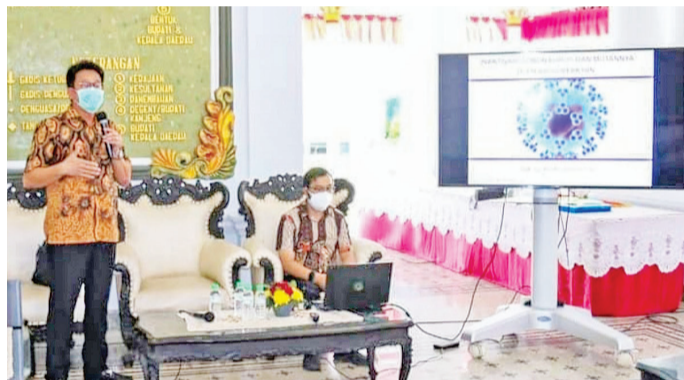
在移交仪式上的说明会