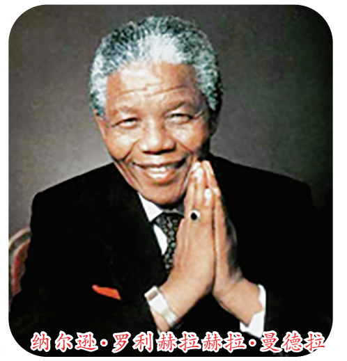
纳尔逊·罗利赫拉赫拉·曼德拉

“钟声响起归家的讯号，在他生命里，仿佛带点唏嘘。黑色肌肤给他的意义，是一生奉献肤色斗争中……”31年前，香港摇滚乐队Beyond主唱黄家驹受到南非黑人领袖纳尔逊·曼德拉的事迹触动，写下这首《光辉岁月》向其致敬。