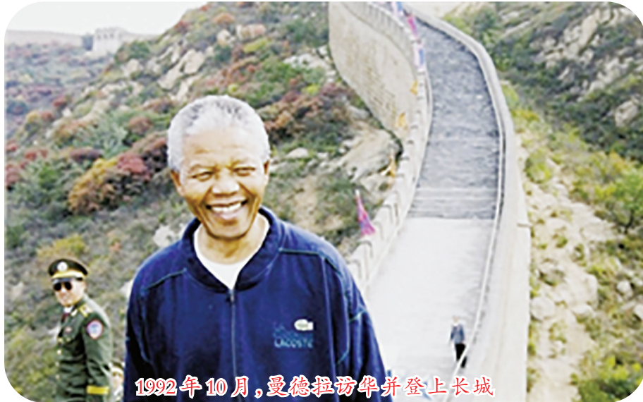
1992年10月，曼德拉访华并登上长城

2013年12月5日，95岁的曼德拉在南非约翰内斯堡的住所内逝世，超过70个国家和国际组织的领导人亲赴南非吊唁。习近平主席在唁电中表示，曼德拉先生是享誉世界的政治家，在漫长的岁月里，领导南非人民经过艰苦卓绝的努力，取得反种族隔离斗争的胜利，为新南非的诞生和发展作出了历史性贡献。作为中南关系奠基人之一，曼德拉先生生前两次访华，积极推动中南各领域友好合作，中国人民将永远铭记他为中南关系和人类进步事业做出的卓越贡献。