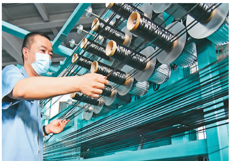
六月十六日，在江苏连云港经济技术开发区，工人在查看碳纤维生产运行情况。