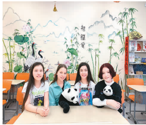
来自俄罗斯喀山183中学六年级的几位小姑娘给自己的组合起了个可爱的名字——“宝宝组合”。图为接受采访的4位参赛者。