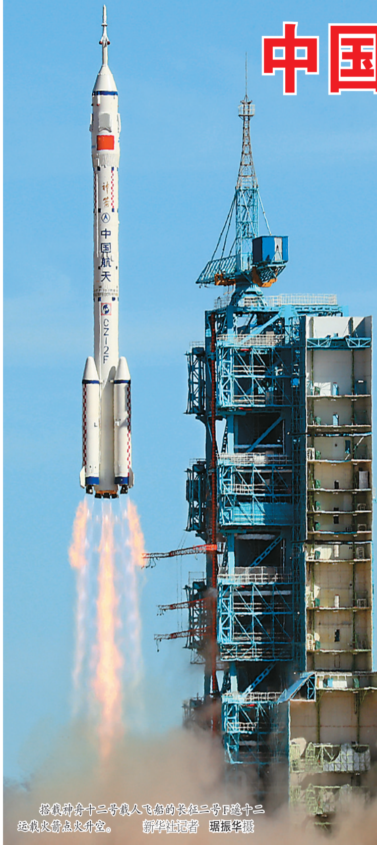
搭载神舟十二号载人飞船的长征二号F遥十二运载火箭点火升空。