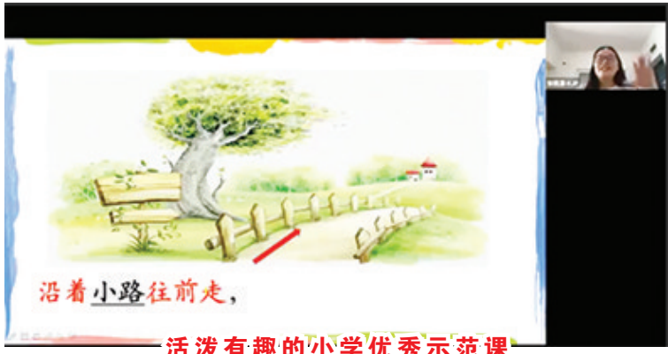
活泼有趣的小学优秀示范课

再看一遍，仔细思考哪些方面出了问题，做“真学问”，不断探索，不断进步！ 时代正高歌猛进，培民教师们正积极拥抱变化，勇敢迎接挑战，激发学生求知欲望，启迪学生人生智慧，助力每个学生成为更好的自己！ 印尼培民学校三宝垄校区 何伟兰