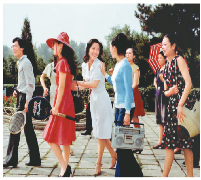
▲ 年轻一代 辽宁鞍山 20世纪80年代