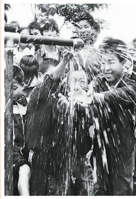
▲ 自来水来了 江西宜春 1993年