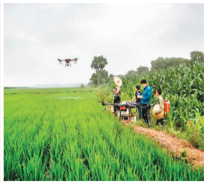
▲ 俺们村有了新“农具” 辽宁铁岭 2019年 ▲ 国产“海鸥”双相机拍摄全家福 1984年

1927年，上海沪江大学的赛道上，运动健儿奋力跨栏；1957年，大华仪表厂里，几位工人围坐在仪器前探讨技术问题；1987年的广州，一位时髦女子正在用“大哥大”打电话；2014年的北京，厨师们举起手机，与朋友分享夜空中绚丽夺目的APEC焰火……由中国文联、中国摄协等主办的“百年·百姓——中国百姓生活影像大展（1921-2021）”日前在北京王府井步行商业街举行。323幅摄影作品以巨幅展板形式亮相。黑白、彩色影像交织，带领观众走进时空长廊，感受中国百姓生活的百年巨变。