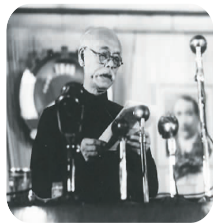
图为1949年，彭泽民在中国人民政治协商会议第一届全体会议上发言。