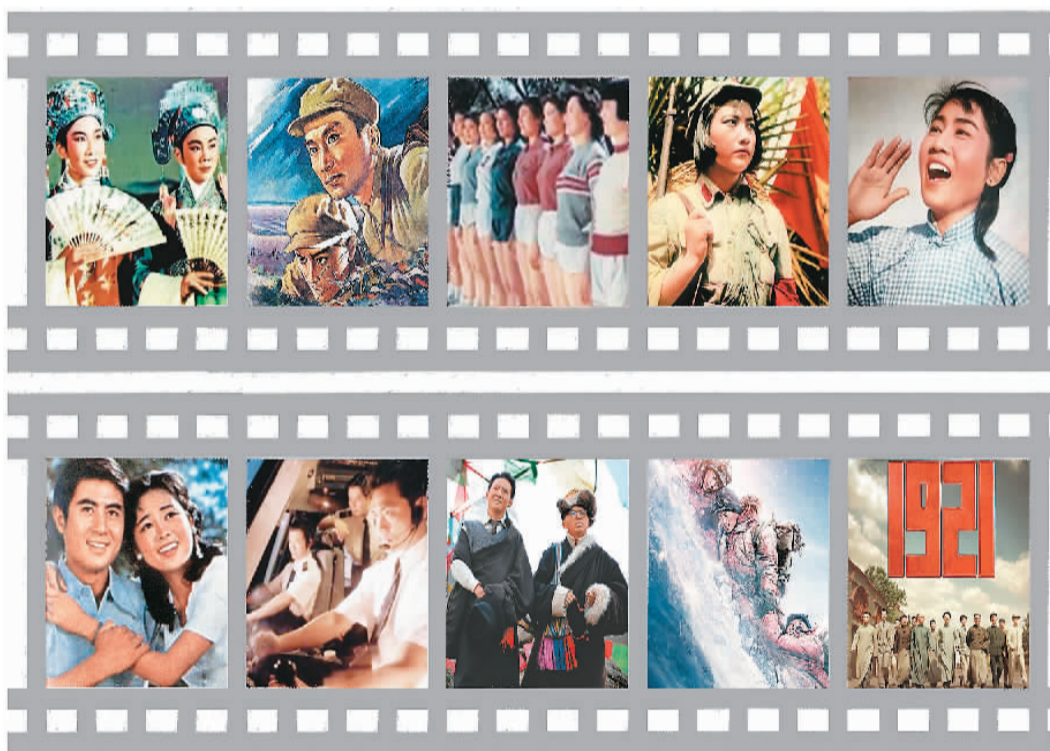
上海电影制片厂部分代表作品。(上排从左至右依次为:《梁山伯与祝英台》《渡江侦察记》《女篮五号》《红色娘子军》《李双双》;下排从左至右依次为:《庐山恋》《紧急迫降》《西线无战事》《攀登者》(1971)《潘旭涛制图》)

“上虞县, 祝家庄, 玉水河边, 有一个祝英台, 才貌双全……”1954年5月20日晚, 瑞士日内瓦湖滨旅馆大厅史无前例地播放了一部来自中国的戏曲电影, 观众是来自不同国家的记者。当放映到精彩片段时, 不少人感动得泪水盈眶。放映结束, 全场爆发出热烈的掌声, 一位美国记者说: “影片太美了!” 这部引起轰动效应的电影, 就是中国代表团在日内瓦会议期间播放的越剧片《梁山伯与祝英台》, 由上海电影制片厂拍摄, 它也是新中国第一部彩色电影。1953年10月29日, 人民日报第三版刊登一则文化简讯《五