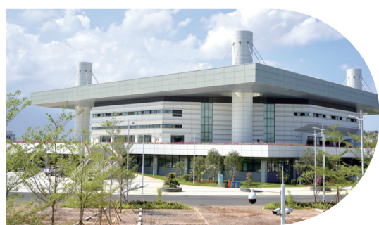
▲汕頭正大體育館是首個竣工驗收的亞青會場館。楊立軒 攝

5月26日，汕頭正大體育館改造工程通過竣工驗收，成為汕頭亞青會25個場館建設項目中首個竣工驗收的場館。亞青會期間，該館將進行羽毛球比賽。