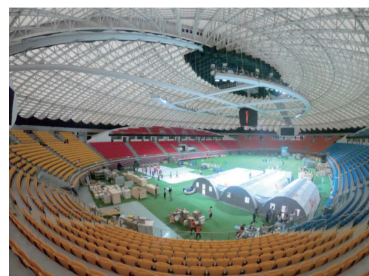
▲6月1日，廣東首個“獵鷹號”氣膜方艙實驗室正式投入使用。

6月1日，金城醫學推出的首個“獵鷹號”氣膜方艙實驗室正式投入使用。移動方艙實驗室“隨到隨檢、即采即檢”，可實現24小時全天候收樣檢測，提高核酸檢測效率。金城醫學副總裁李慧源說，隨着氣膜方艙實驗室、集裝箱實驗室等與總部實驗室結合，接下來若按照5混1的形式，