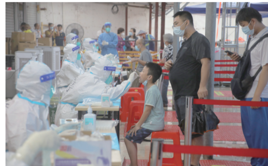
▲廣州一核酸檢測點，工作人員為市民做核酸檢測。符超軍 攝

爍，人聲鼎沸，人們自發站在陽臺，揮舞着手機電筒大聲高唱《聽我說謝謝你》，歌聲一浪接着一浪。疫情無情，人間有愛。