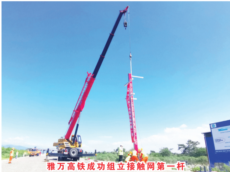
雅万高铁成功组立接触网第一杆