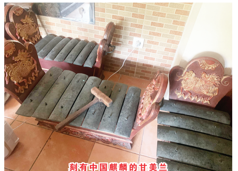
刻有中国麒麟的甘美兰

走进巴厘沙努区的Mekar Bhuana甘美兰音乐舞蹈中心,与其说是艺术工作坊,更是一个活生生的古董乐器展览区和互动博物馆。此中心主要是记录、重建和存档稀有的音乐形式,如可追溯到14至17世纪的宫廷音乐Semara Pegulungan、Selonding和Gambang等罕见的古老音乐;同时与老