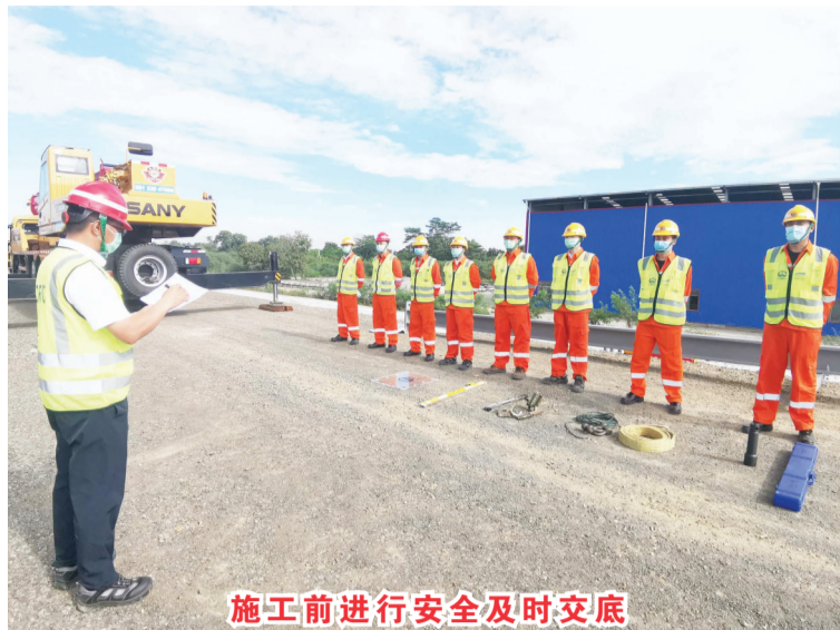
施工前进行安全及时交底