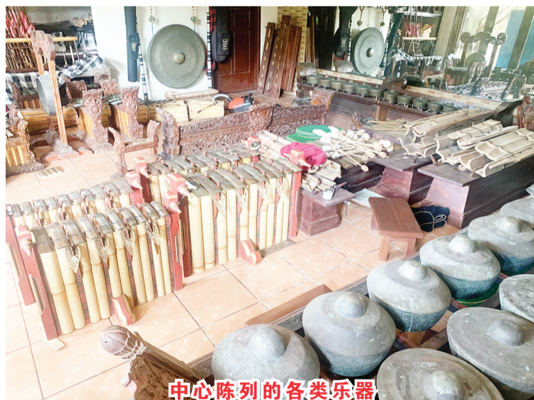
中心陈列的各类乐器