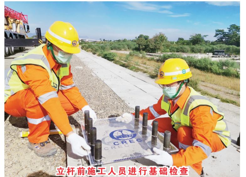
立杆前施工人员进行基础检查

中新网6月16日电(记者林永传)16日,中国中铁印尼雅万高铁项目经理部在印尼万隆德卡鲁尔车站成功组立接触网第一