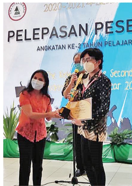
高中毕业班班主任颁奖