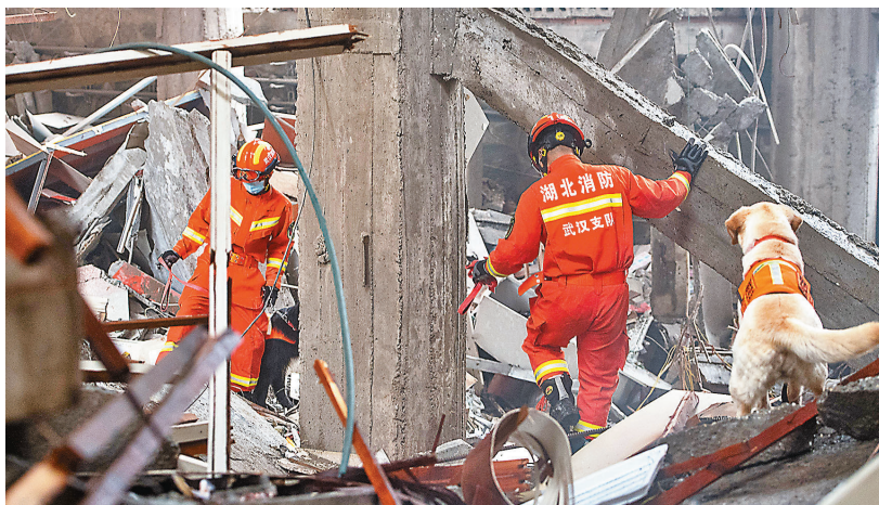
●湖北十堰燃氣爆炸已造成25人死亡。圖為6月13日消防救援人員和搜救犬在現場搜救。

湖北十堰燃氣爆炸事故發生後，國務院安委會、應急管理部持續調度現場救援處置進展，立即派出由應急管理部領導帶隊的工作組趕赴現場指導事故處置