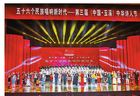
●第三屆(中國·玉溪)中華詩人節在玉溪市舉行。

活動期間，全國詩詞名家雲集玉溪采風，感受人文風情，領略自然美景。雲南玉溪享有「四鄉」——聶耳故鄉、雲煙之鄉、花燈之鄉、高原水鄉的美譽。近年來，該市成功創建中國最佳楹聯文化城市、中國楹聯文化強市，並晉入「中華詩詞之市」行列。