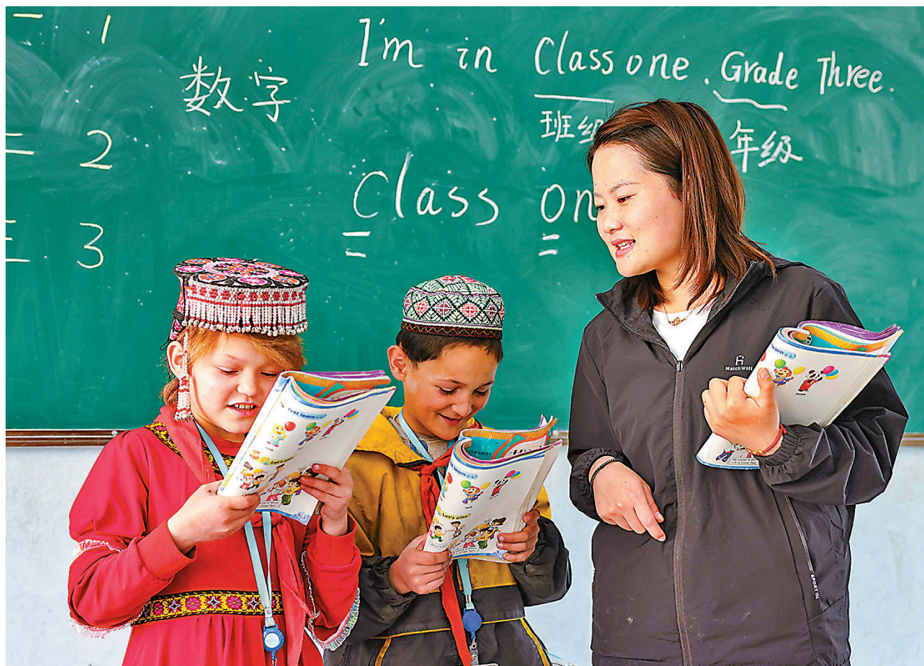
●2010年至2020年，新疆總人口和維吾爾族人口均保持穩步增長的態勢，其中維吾爾族人口增加162.3萬人，增長16.2%。圖為今年5月新疆阿克陶縣阿勒瑪勒克村小學的小學生與當地支教老師在英語課堂上互動。

根據第七次全國人口普查結果，2020年11月1日零時新疆常住人口為25,852,345人，這一數字與2010年第六次全國人口普查的21,813,334人相比，增加4,039,011人，增長率為18.52%，年平均增長率為1.71%，分別比全國平均水平(5.38%)高出13.14個百分點和1.18個百分點。