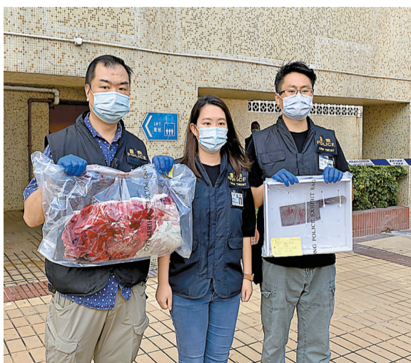
警方在兇案現場檢獲染血枕頭和菜刀。記者 區天海攝

【香港商報訊】記者區天海報道：屯門發生丈夫疑殺妻後跳樓雙屍命案，警方昨日凌晨接報有人從屯門市廣場高處墮下，到場證實一名六旬男子不治，其後在其家中發現男死者的妻子倒臥床上，送院後亦告死亡，警方人員在現場檢獲染血菜刀，相信兩人生前並無爭執，不排除有人殺妻後畏罪自殺，正循兩人感情、身體精神和財務狀況調查犯案動機，現列作兇殺及自殺案處理。