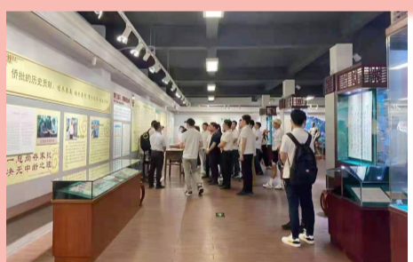
↑汕頭市民參觀汕頭市檔案館僑批分館(僑批文物館)