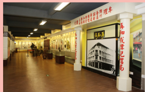
↑汕頭市檔案館僑批分館(僑批文物館)展廳

觀了具有潮汕鄉特色的汕頭市檔案館僑批分館（僑批文物館）。習近平總書記聽取僑批歷史和潮汕華僑文化介紹。他強調，“僑批”記載了老一輩海外僑胞艱難的創業史和濃厚的家國情懷，也是中華民族講信譽、守承諾的重要體現。要保護好這些“僑批”文物，加強研究，教育引導人民不忘近代中國經歷的屈辱史和老一輩僑胞艱難的創業史，並推動全社會加強誠信建設。習近平總書記的重要指示在全社會引起了強烈反響，在潮汕大地掀起弘揚僑批文化精神、徵集保護僑批檔案的熱潮。揭陽市的陳元列老人，把珍藏的“家族僑批”和其他涉僑文物資料近80件一次性無償捐獻出來。著名企業家馬姪女士將已故丈夫麥保爾先生收藏的4萬餘件僑批實物無償捐贈給汕頭市檔案館僑批分館（僑批文物館），在社會上引起良好影響。 今年來，為理順僑批檔案工作管理體制，汕頭市委辦公室、市政府辦公室印發《汕頭市加強僑批檔案工作實施方案》，將僑批檔案依法納入檔案部門管理，將僑批文物館作為市檔案館僑批分館，增加資金投入，着力做好僑批搶救修復、研究推廣、開發利用，着力推進僑批文物館提質升級。經過精心籌備，汕頭市檔案館僑批分館（僑批文物館）在今年“五一”節試開放，6月9日正式全面對外開放。