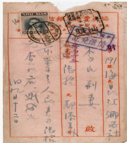
↑新中國成立後，由中國人民銀行辦理匯兌手續的最早一幫僑批

1949年7月23日中共中央華南分局在潮汕解放區揭西河婆鎮成立南方人民銀行潮汕分行；1949年10月20日開始籌建中國人民銀行潮汕分行並發行“南方人民銀行幣”，作為華南解放區統一的本位幣。簡稱“南方券”。 1949年10月24日汕頭市解放。 1949年11月5日中國人民銀行在汕頭臨時接管僑批結匯業務。11月11日，停滯數天的第一幫僑批經由中國人民銀行潮汕分行辦理結匯，這是汕頭解放後第一幫僑批匯款。 1949年11月11日由中國人民銀行結算解付的批款，成為新中國成立後恢復僑批業務的標志。 1949年11月11日的實寄批，既是潮汕僑批史上重大轉折點的記載，也是汕頭金融史的實證。