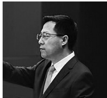
外交部发言人赵立坚。

“七国集团峰会联合公报表示要共同努力剥离全球供应链中的‘强迫劳动’行为,希望美方切实剥离自身烟草行业等行业存在的雇佣童工及强迫劳动现象,切实保障儿童等脆弱群体的合法权益。”赵立坚说。