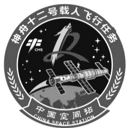
技术验证阶段第四次飞行任务,也是空间站阶段首次载人飞行任务。

神舟十二号载人飞行任务是空间站关键技术验证阶段第四次飞行任务,也是空间站阶段首次载人飞行任务。